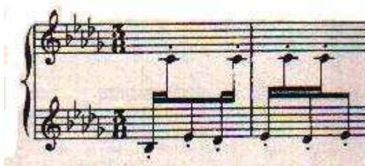
Figure 1. El Albaicin (Albeniz)

connus l'intonation de formules langagières, par exemple de « Ah vous dirais-je maman » de Mozart un patron exclamatif comme celui de « En voilà une idée ! ». Ces « clichés mélodiques » spécifiques à une formule langagière donnée se distinguent de mélodies plus « reproductibles » comme celles qui peuvent être associées à une phrase interrogative. Il est possible d'étendre ce parallélisme à de nombreux exemples en ajoutant un autre paramètre, le rythme. Mentionnons la première mesure de El Albaicin d'Albeniz (Figure 1).