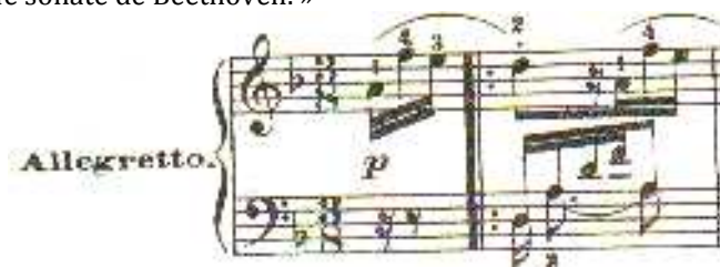
Figure 5. Allegretto (Beethoven)

Il suggère également d'analyser ces énoncés « par la synthèse », c'est-à-dire en les rapprochant d'œuvres musicales, sans toutefois proposer d'application en apprentissage : « À partir d'une micro-structure plus régulière, la construction des macro-structures quasi mélodiques devient possible. Le Bonjour, Madame! de la vendeuse se caractérise par des intervalles fixes... qui rappellent la phrase bien connue de l'allegretto de la XVIIe sonate de Beethoven. »