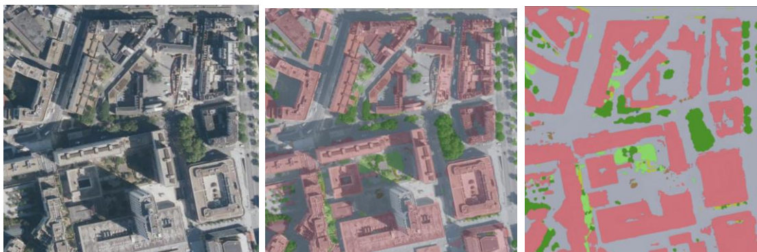
Figure 1 : illustration de l'identification de l'occupation du sol projet CoSIA (IGNcommunication 2023)

Les données d'occupation du sol et de végétalisation en zone urbaine sont relativement mal renseignées, ce qui exige de les renseigner manuellement. Nous utilisons donc les développements récents du traitement d'images satellites pour automatiser et simplifier la description sous forme d'ensembles, tels que dans l'exemple de la Figure 1, comme base de travail avant complétion manuelle à partir de vues satellite ou de plans de projets.