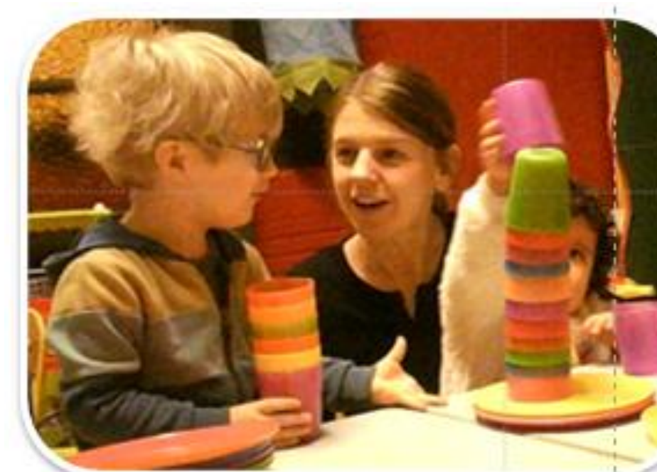
Jeux libres (JL)