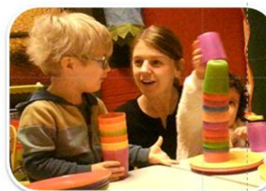
Jeux libres (JL)