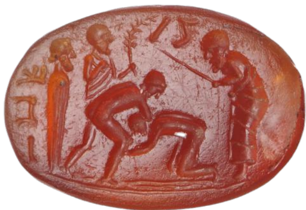
Fig. 8 – Deux athlètes s'entraînant à la lutte. Cornaline. 7 x 11 x 3 mm. Fin du I er siècle av. J.-C.

La scène de lutte a conduit les commentateurs de ces pierres gravées à identifier dans l'homme à la baguette un pédotribe, le professeur officiant dans les gymnases, chargé de l'entraînement des athlètes. L'objet qu'il tient dans sa main est un radius , attribut que l'iconographie glyptique associe régulièrement à ce personnage pour indiquer son statut. Se tenant légèrement en retrait, l'homme endosse le statut d'arbitre et supervise d'un œil attentif le combat qui se déroule sous ses yeux, veillant au bon respect des règles.