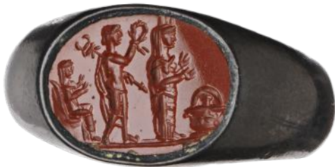
Fig. 6 – Mercure couronnant la statue d’Aphrodite d’Aphrodisias. Jaspe rouge. 13 x 7 x 4 mm. II e siècle ap. J.-C.