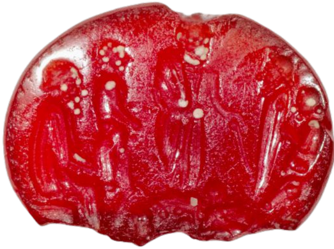
Fig. 1 – Cornaline. 6 x 8 x 1,5 mm. Époque républicaine romaine. Ancienne collection du comte Pauvert de la Chapelle. Département des Monnaies, Médailles et Antiques, Bibliothèque nationale de France, inv. Pauvert.111.