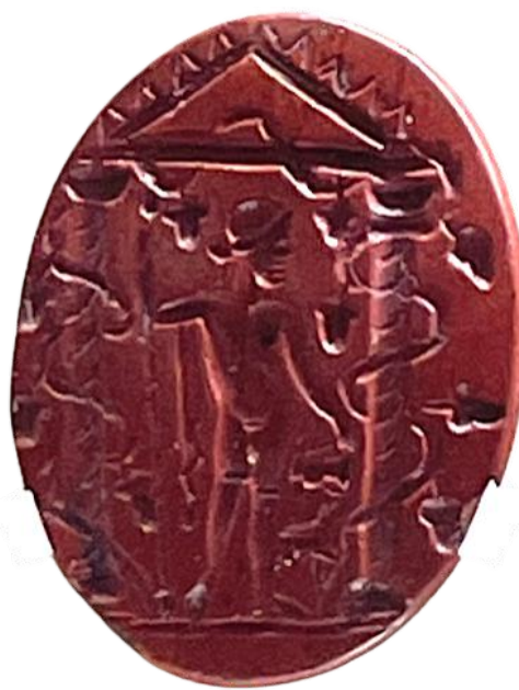
Fig. 4 – Image culturelle de Dionysos dans un temple distyle. Jaspe rouge. 16 x 13 mm. Époque impériale. Musée numismatique d'Athènes.