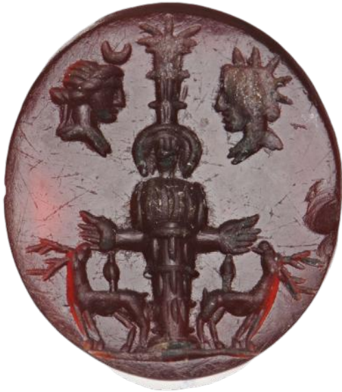
Fig. 5 – Artémis d’Éphèse. Cornaline. 16 x 13,5 x 3,5 mm. II e siècle ap. J.-C. Provient d’Isparta, en Turquie.