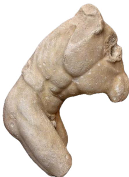
Fig. 10 – Réplique romaine du Discobole de Myron. Marbre. Haut-Empire romain. Découverte dans le lit de l'Aude au XVIII e siècle. Musée Saint-Raymond, Toulouse.