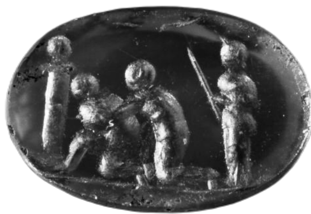
Fig. 9 – Deux athlètes s'entraînant à la lutte. Cornaline. 6 x 9 x 2 mm. Milieu du I er siècle av. J.-C. Originaire d'Asie Mineure. The J. Paul Getty Museum, Malibu. CC0 Public Domain.