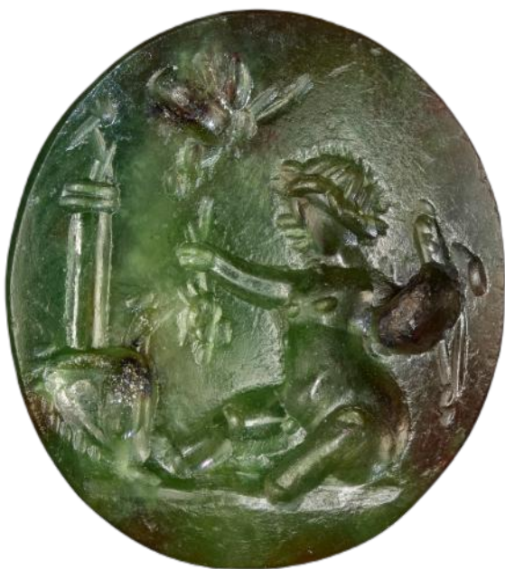
Fig. 3 – Éros assis face à une petite colonne supportant une statuette de Priape. Plasma. 10 x 9 x 3 mm. I er siècle ap. J.-C. The J. Paul Getty Museum, Malibu. CC0 Public Domain.