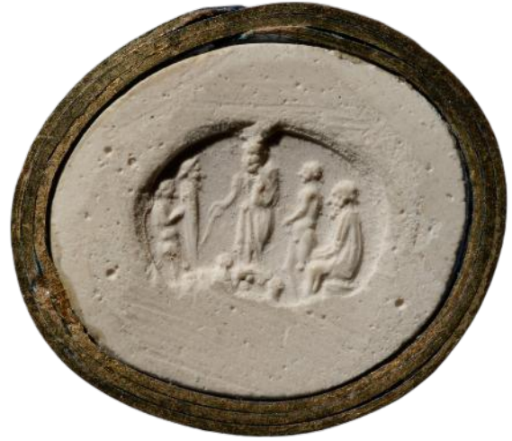
Fig. 2 – Empreinte moderne de la cornaline « Pauvert.111 ». Département des Monnaies, Médailles et Antiques, Bibliothèque nationale de France.