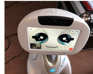
Figure 1: Robot Buddy de Blue Frog Robotics

l'opportunité d'étudier la pertinence du développement d'un tel média d'interaction dans un cadre plus général de téléprésence, mais aussi de co-présence. Ainsi, avec un smart-phone et/ou une tablette, les utilisateurs ont dans leurs mains des appareils très puissants avec des microphones et des haut-parleurs pour reconnaître le langage parlé, des caméras pour reconnaître personnes ou objets et montrer des informations dans une image (p.ex. réalité augmentée), des écrans tactiles qui permettent d'interagir avec les informations affichées et l'accès aux données de l'utilisateur pour adapter l'interaction en fonction de l'âge ou des éventuelles déficiences des utilisateurs.