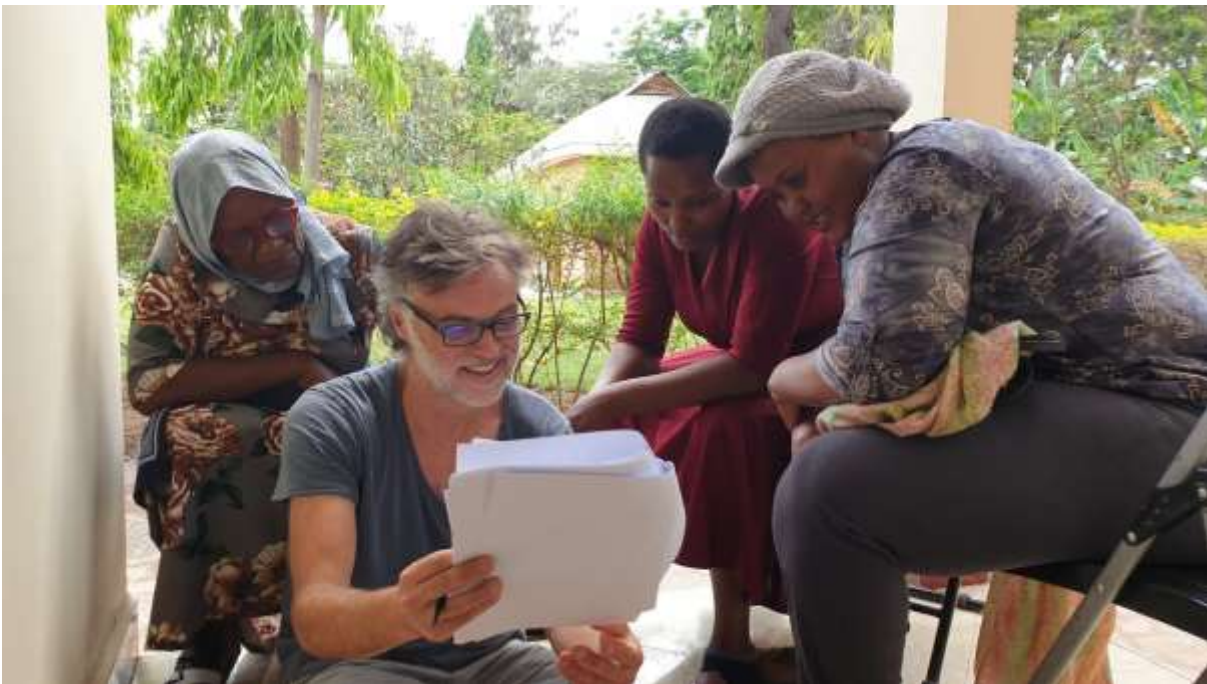
Phase préparatoire à l'enregistrement de locutrices Iraqw (Mto Wa Mbu, Tanzanie, décembre 2022)