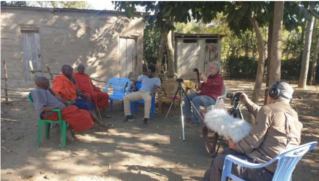
Enregistrement audiovisuel d'histoires Maasai (Arusha district, Tanzanie, juin 2022)