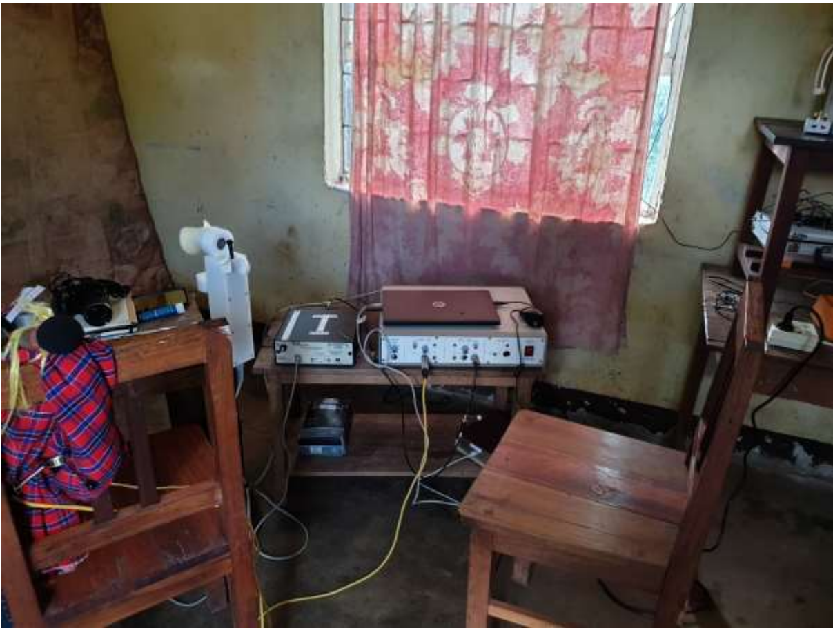
Laboratoire de terrain (Kwermusl, Tanzanie, février 2020)