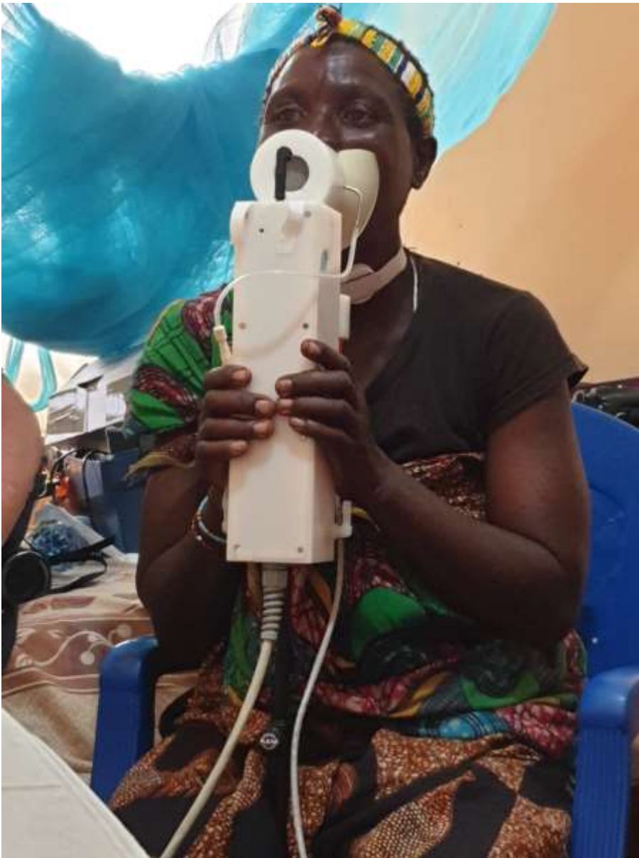
Enregistrement d'une locutrice Hadza avec le dispositif d'aérophonométrie EVA2 (Mwangeza, Tanzanie, février 2020)