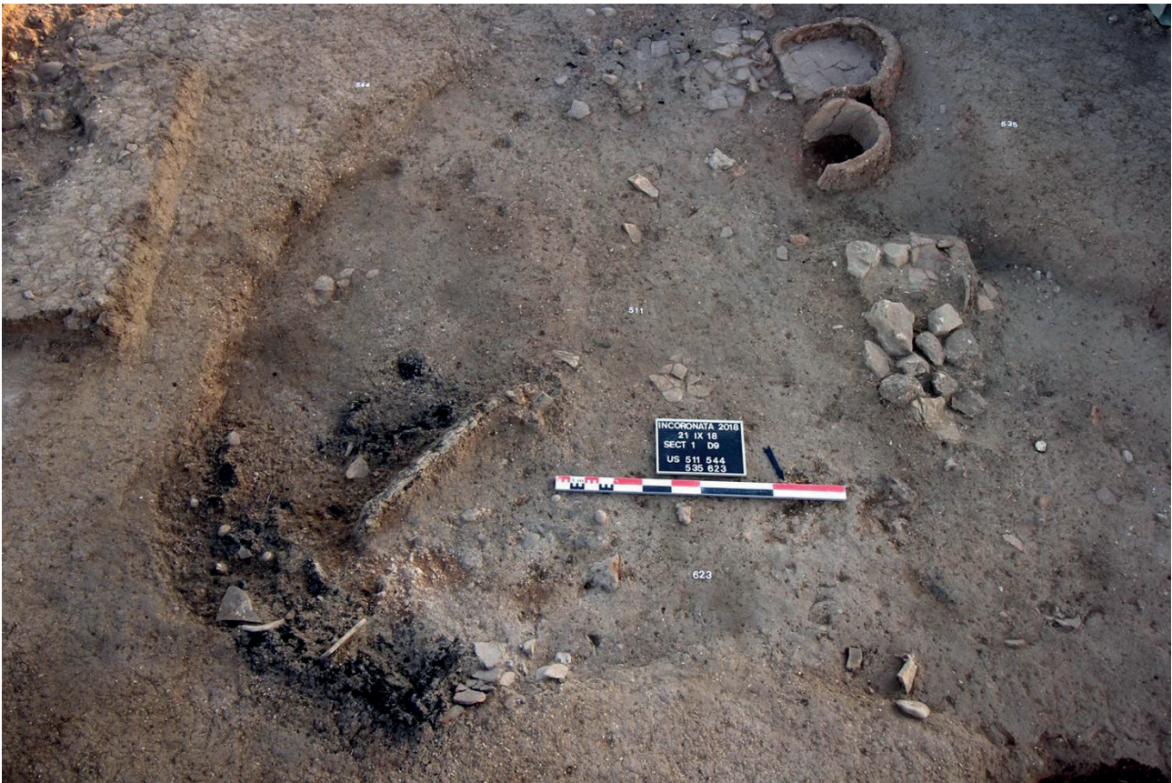
Fig. 3 – Incoronata, secteur est : la « fosse-atelier » contenant les deux petits fours et une structure foyère, vu du nord (Denti, 2019, fig. 7).