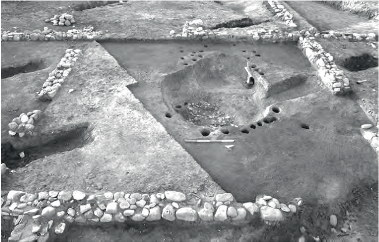
Fig. 4 – Policoro, capanna 1 (Verger et Pace, 2020, p 181, fig. 5a). Fig. 4 – Policoro, capanna 1 (Verger and Pace, 2020, p. 181, fig. 5a).

peut être lié à la création de tout récit ancré dans l’imaginaire collectif) réside dans la création d’un système de pensée où tous les éléments se justifient réciproquement. Dans ce cadre d’étude, cette figure autotélique s’illustre par un développement des connaissances sur les architectures non maçonnées restreint par un primitivisme épistémique, provoquant un usage générique du terme « fonds de cabane », participant lui-même à l’enracinement de l’idée de communautés locales vivant dans des « trous » et légitimant – de facto – une vision dichotomique grec/non grec, civilisé/barbare.