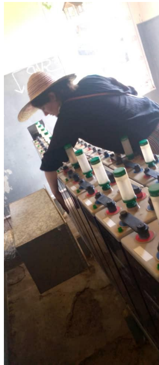
Figure 3. Le local des batteries doit être suffisamment ventilé car une chaleur excessive peut dégrader les batteries (2021, Sénégal).