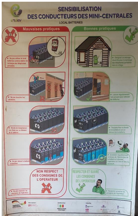
Figure 2. Affiche détaillant les mauvaises et bonnes pratiques pour la gestion du mini-réseau (2021, Sénégal).