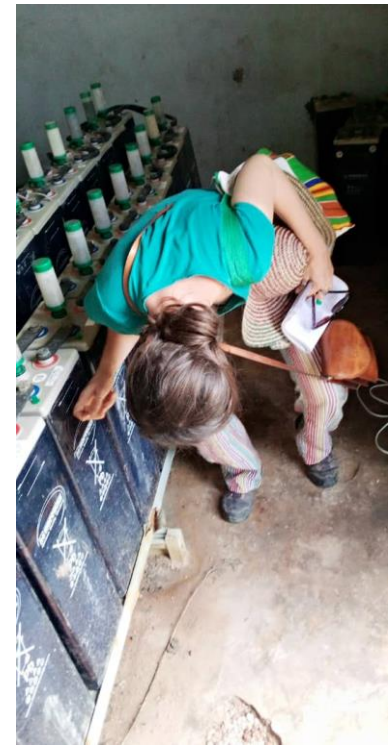
Figure 4. Les batteries au plomb doivent être remplies régulièrement à l'aide d'eau distillée. On peut voir le niveau d'eau en tapotant les batteries pour faire remonter des bulles d'eau (2021, Sénégal).

Le second type de rôle, la gestion des paiements, prend différentes formes selon les mini-réseaux. Elle peut impliquer ou non le technicien local, dépendre ou non de dispositifs numériques, s'effectuer en « Pay-as-you-Go » ou par facturation fixe.