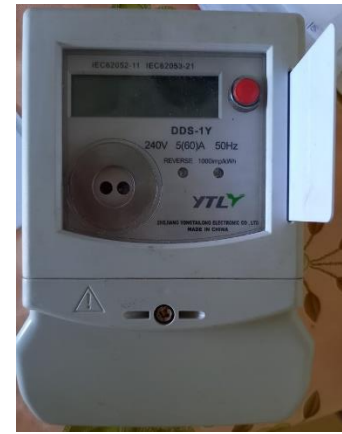
Figure 7. Carte rechargée dans un boîtier pour créditer des unités d'électricité. La carte est ensuite insérée dans le compteur de l'utilisateur (village O., Kenya, 2022)

Finalement, la régulation des usages correspond au contrôle de la consommation d'électricité des usagers, par la veille des fraudes et de l'achat d'équipements non autorisés, mais aussi par l'équilibrage de la consommation d'électricité dans le village. Je détaillerai ce point dans la section 4.3.