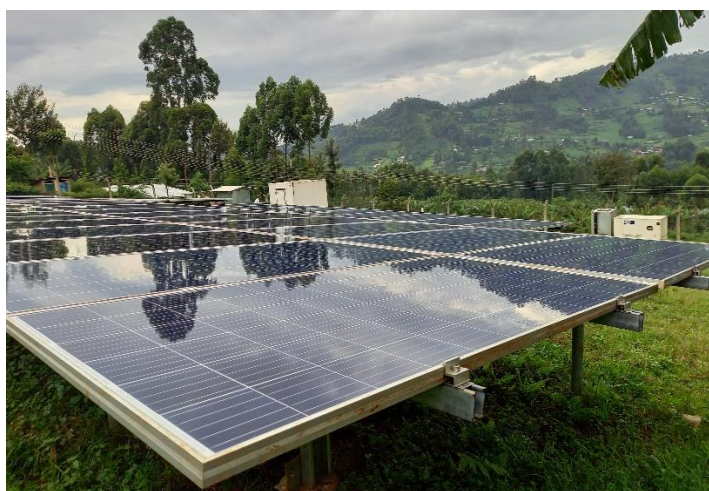
Figure 1. Mini-réseau hybride solaire et générateur diesel (Kenya, 2022).

Ces infrastructures « hors-réseau » sont destinées en particulier aux localités où l'extension du réseau est perçue comme trop coûteuse ou impossible, c'est-à-dire des zones éloignées du réseau électrique ou dans des géographies particulières (îles, zones montagneuses, jungle, etc).