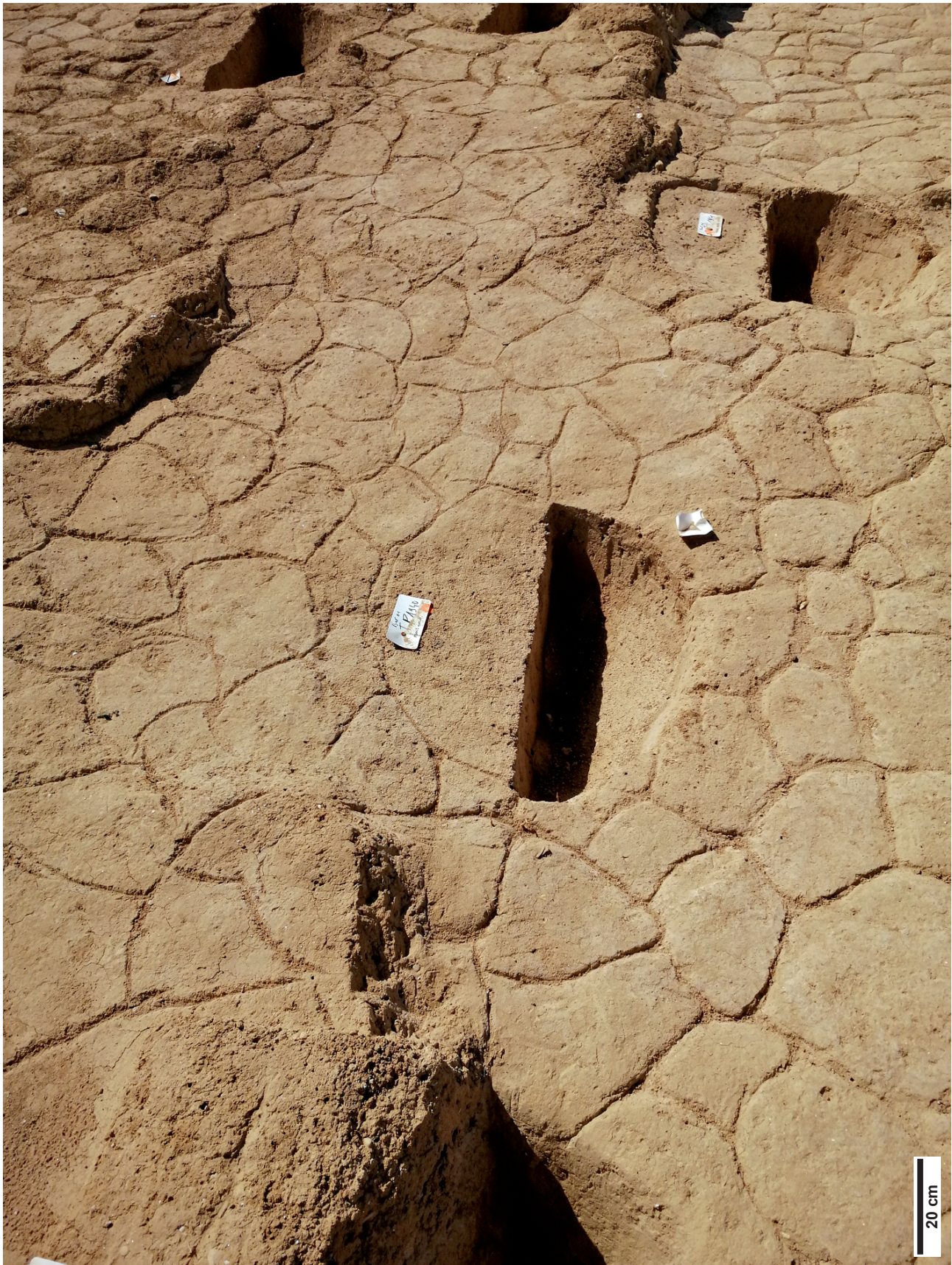
Fig. 5 – Site du boulevard Paul-Vaillant-Couturier à Ivry-sur-Seine (Val-de-Marne, France) : aménagement en « briques de terre crue modelées » et trous de poteau, Néolithique moyen (Cerny ).

Fig. 5 – Site on the Boulevard Paul-Vaillant-Couturier in Ivry-sur-Seine (Val-de-Marne, France): Landscaping of “modelled mud bricks” and postholes, Middle Neolithic (Cerny).