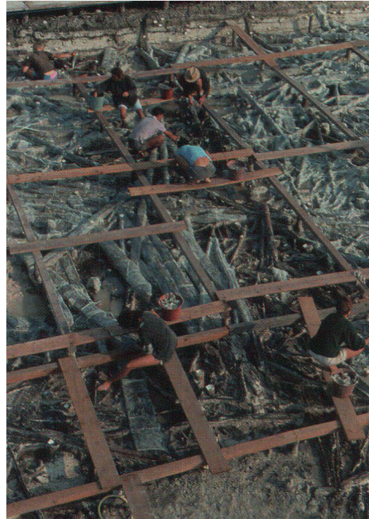
Fig. 3 – Chalain 3 (Jura, France) : décapage de planchers en bois effondrés sur la couche archéologique ; couche VIII, Horgen, début du 32 e siècle avant notre ère (d'après Corboud et Pétrequin, 2004, fig. 10).

Fig. 2 – Croce del Papa, Nola (Campania, Italy): Detail of the thatched roof and framework elements of House A, dated to the Early Bronze Age (Albore Livadie et al. , 2020, fig. 29b).