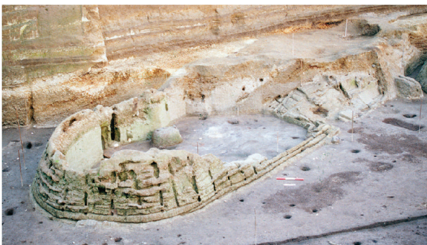
Fig. 2 – Croce del Papa, à Nola (Campanie, Italie) : détail du toit de chaume et des éléments de la charpente de la maison A, datée de l'âge du Bronze ancien (Albore Livadie et al. 2020, fig. 29b).

De grandes avancées ont également été réalisées ces vingt dernières années concernant la caractérisation des architectures en terre massive, après l'impulsion de la fin des années 1980-1990 avec les études réalisées sur les habitats de l'âge du Fer et d'époque antique du Midi méditerranéen (Chazelles et Poupet, 1984 et 1985 ; Chazelles-Gazzal, 1997 ; Cammas, 2003). Le site néolithique de Lillemer, en Bretagne (Laporte et al. , 2015), fournit un bon exemple de détection de ce type d'architectures (fig. 4), suite aux premières découvertes d'architectures néolithiques en bauge dans le sud de la France (Jallot, 2003 ; Watez, 2003 et 2009 ; Sénépart et al. , 2015 et 2018a). La prise en compte des restes de terre à bâtir, et notamment des fragments de torchis sur clayonnage cuits lors d'incendies, a permis de mettre en évidence un large éventail de techniques du Néolithique à la fin de l'âge du Fer du fait de développements méthodologiques fondés sur la caractérisation morpho-fonctionnelle et technologique des vestiges (Tasca, 1998 ; Moffa, 2002 ; Chazelles, 2003 ; Duvernay, 2003 ; Onfray, 2012 et 2014 ; Bonnaire, 2014 et 2016 ; Labille et al. , 2014 ; Peinetti,