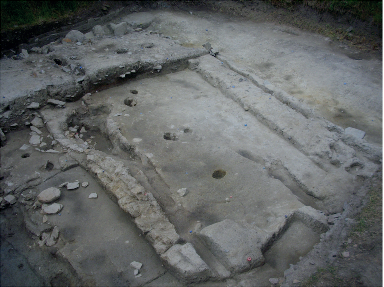
Fig. 4 – Lillemer (Ille-et-Vilaine, France) : vestiges de bâtis en terre conservés en élévation et piégés sous un talus du Néolithique moyen.