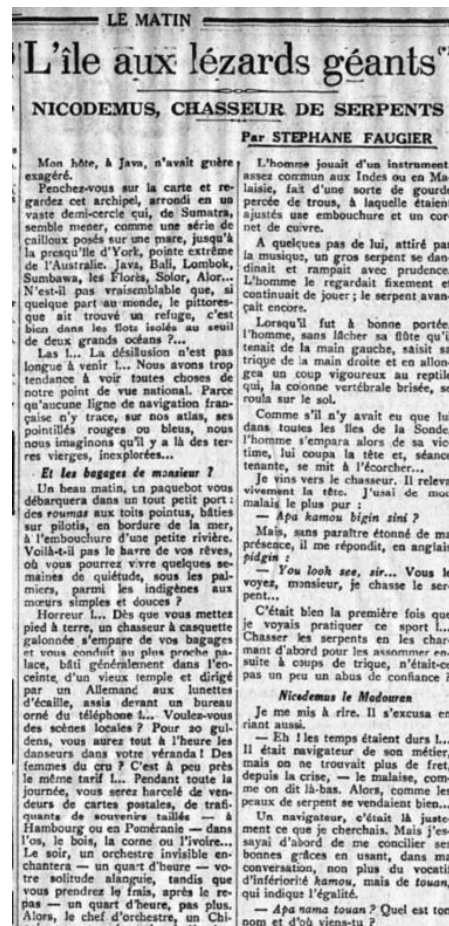
Fig. 8 : Le Matin , 3 septembre 1933