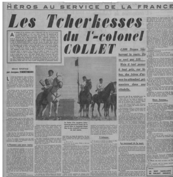
Fig. 18 : Paris-Soir, 8 avril 1939