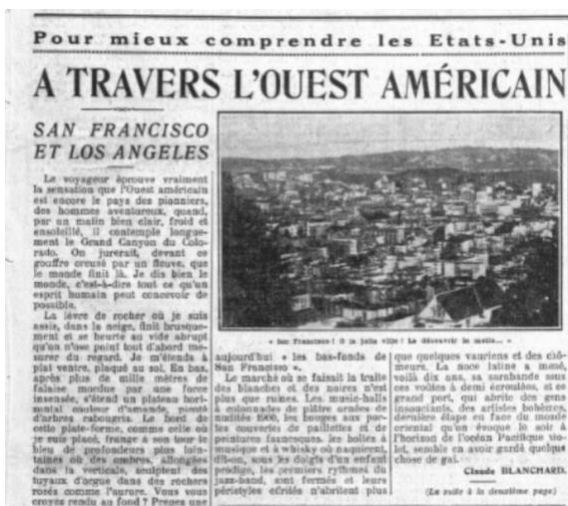
Fig. 9, 10 et 11 : Le Petit Parisien du 22 juillet au 24 août 1930

Entre 1975 et 1980, Jean-Claude Guillebaud, lauréat du Prix Albert Londres en 1972 pour le quotidien Sud-Ouest , se réapproprie le procédé de l'écriture viatique dans des enquêtes menées au large de l'Océan Pacifique pour le quotidien Le Monde . Sur le plan formel comme sur celui du traitement du sujet, les séries « Les Confettis de l'empire 71 » et « Un voyage en Océanie 72 » témoignent du désir de découverte de