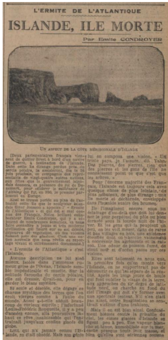
Fig. 4 : Le Journal , 20 juin 1930

L'Islande personnifiée, terre de solitude et de mystères, inscrit le travail du grand reporter dans le sillage des écrits de Pierre Lotti. L'axiome du terrain prime dans la construction du récit, la description topographique est régulièrement ponctuée d'impressions. Émile Condroyer confie qu'« une odeur de poisson fumé, de stout noir et d'océan passe sur ces visions 22 ». Il présente divers tableaux d'une Islande poétique, saisie à la manière d'un photographe, dès l'approche de la côte, alors que « des caps cassés d'équerres s'avancent insensiblement, immenses et noires étraves de fabuleux navires déchirant le brouillard et ouvrant la mer 23 ». Des paysages islandais aux hommes qui les habitent, chez Condroyer, les procédés factographiques renouent avec le principe d'autopsie (chose vue, vécue, ressentie). La fonction d'enquêteur in situ dynamise la perception subjective, la position auctoriale. Ainsi, dans « Reykjavick, port isolé et cœur de l'Islande 24 », il partage le portrait d'« une petite ville sans relief, qui semblait plantée comme un sombre décor au bord d'une baie aux rivages nus. On sentait le vide derrière elle », affirme-t-il. Après un parcours dans le massif de l'Esja, Émile Condroyer longe la digue reliant le port et en propose un portrait animé :