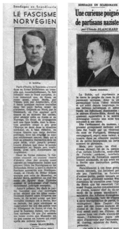
Fig. 12 et 13 : Le Petit Parisien , 1934