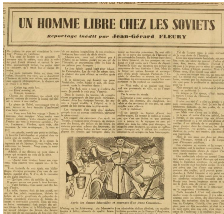
Fig. 17 : Gringoire , du 15 mai au 17 juillet 1936