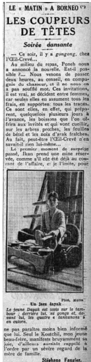
Fig. : 6 : Le Matin , 15 août 1932