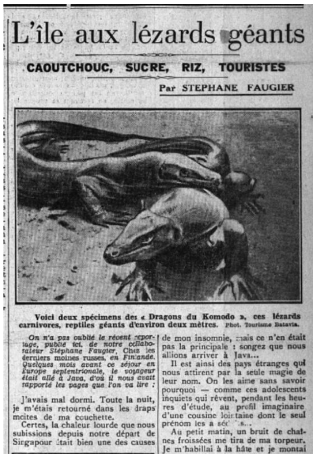
Fig. 7 : Le Matin , 1 er septembre 1933.