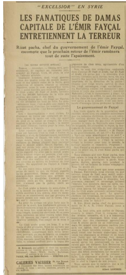
Fig. 3 : Excelsior , 29 décembre 1919