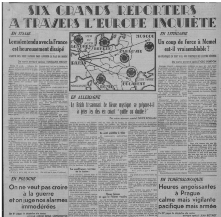
Fig. 14 : Le Journal , 16 - 22 avril 1935