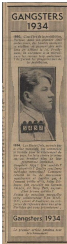
Fig. 15 : Le Journal , 6 septembre 1934