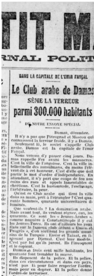
Fig. 1 : Le Petit Marseillais , 3 janvier 1920.

correspondant dans la Grande Guerre et de la pratique d'un journalisme politique, exercé, en 1920, au Moyen-Orient, par exemple, sous le pseudonyme D'Aigues-Mortes 4 pour Le Petit Marseillais : « Journal politique quotidien ». Publiés respectivement à la Une les 3 et 5 janvier 1920, les deux premiers articles, « Le Club arabe de Damas sème la terreur parmi 300 000 habitants 5 » et « Les difficultés de la France 6 » témoignent, sur deux colonnes, des tensions nationalistes qui agitent la capitale de l'émir Fayçal, alors de voyage en Europe (Fig. 1 et 2). Au moyen d'une comparaison des mouvements indépendantistes arabo-musulmans avec le régime soviétique et le bolchévisme, Londres dénonce les méfaits dirigés par « le club arabe » composé, pour reprendre ses termes, de « quarante universitaires illuminés 7 » et propose une lecture sacralisant la présence française au Proche-Orient. Le sujet dresse des portraits sociopolitiques des villes de Damas et de Beyrouth. Chacune apparaît aux prises avec les milices du « El Nadi el Arabi », en écho à l'article publié le 29 décembre 1919, qu'il signe dans Excelsior 8 (Fig. 3). Londres présente l'émir Fayçal comme une sorte de pantin désabusé et Damas comme une ville plongée dans le chaos et la violence de fanatiques. La rhétorique discursive recourt au régime sémantique de l'angoisse, de la domination par la terreur, des massacres. Le parti-pris du grand reporter s'affirme ouvertement anti-indépendantiste, mais sous pseudonyme 9 .