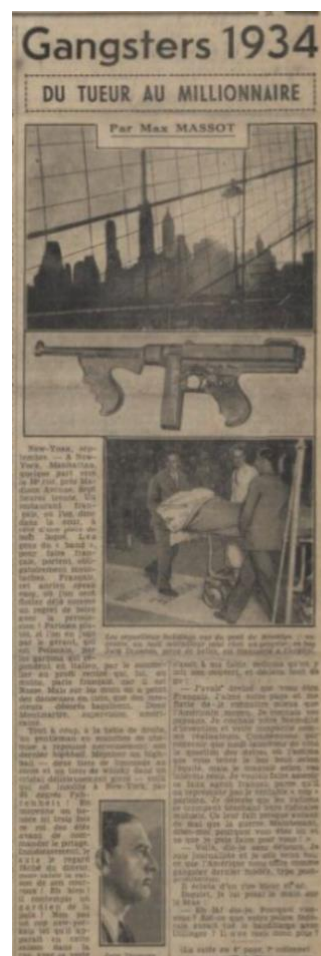
Fig. 16 : Le Journal , 9 septembre 1934