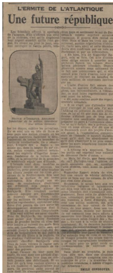
Fig. 5 : Le Journal, 26 juin 1930

Différemment, le récit témoigne de la modernité à l'œuvre dans l'Austurstroeti et Laugavegur 26 , de l'acquisition de voitures de luges, de « limousines étincelantes et capitonnées », de « ce que l'industrie automobile produit de plus luxueux, de plus parfait 27 », souligne-t-il, par les familles aisées de Reykjavick. Le rapport de la chose vue se fait sous l'aspect d'une promenade attentive, tandis que l'actualité politique ou économique est circonscrite autour de l'histoire du parlement « vieux de dix siècles 28 », berceau de l'Islande — l'édifice est présenté en détail —, ou autour du développement actuel du commerce des pêcheries, depuis 1919 29 , et le projet d'exportation jusqu'en Afrique 30 (Fig. 5).