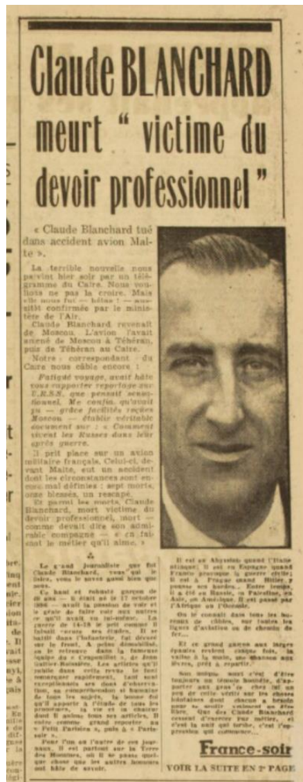
Fig. 19 : France-Soir, 21 septembre 1945