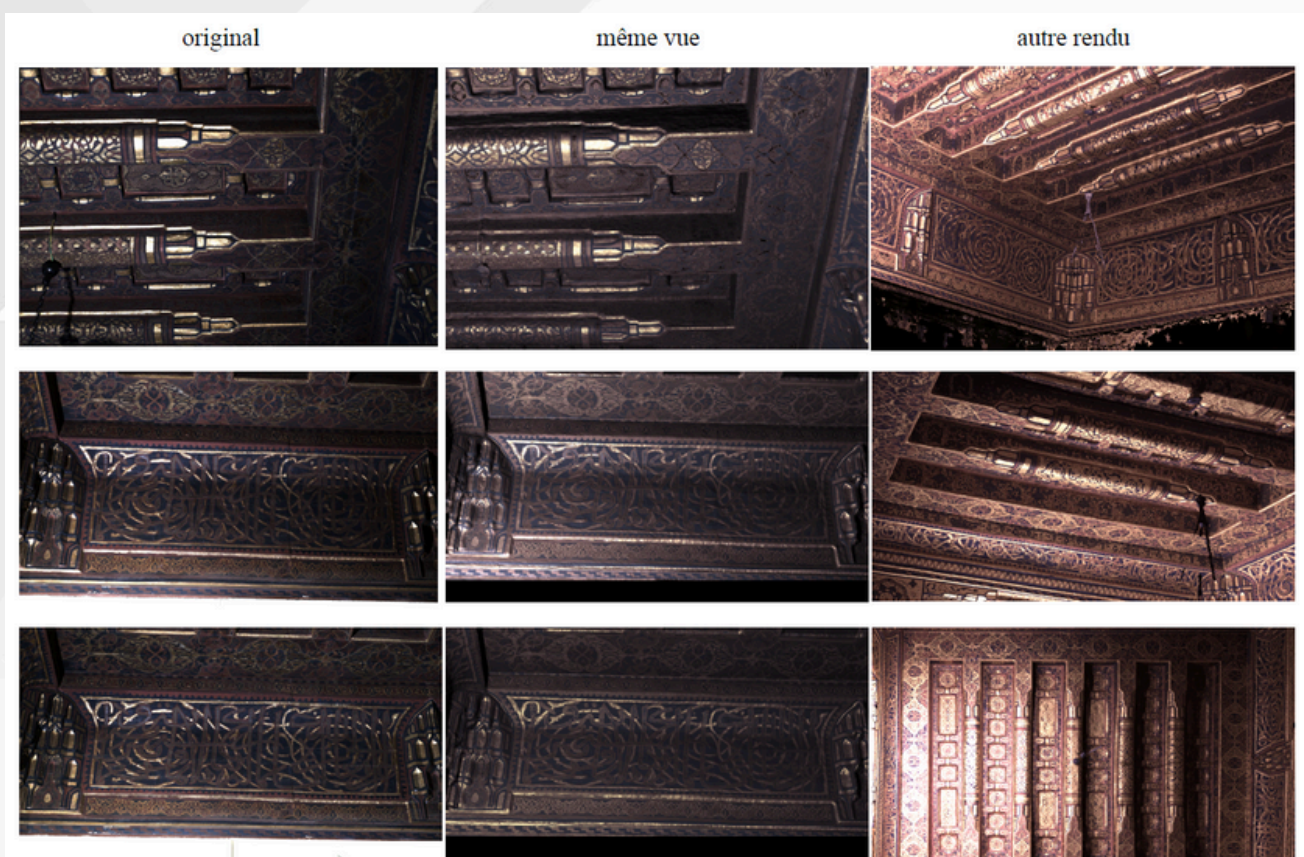
Figure 3 : Comparaison, sur un plafond de l'ambassade de France au Caire, entre les photographies d'origine (à gauche) et recalculé avec notre mesure de SVBRDF (en centre). À droite, un nouveau point de vue a été généré.

Ce travail a été financé par le projet SMART 3D (financement MITI CNRS 80 prime) et supporté par le projet Tremplin CNRS \mu ChaOS. Il a été réalisé dans le cadre de la thèse de Corentin Cou [9] à qui cette communication est dédiée.