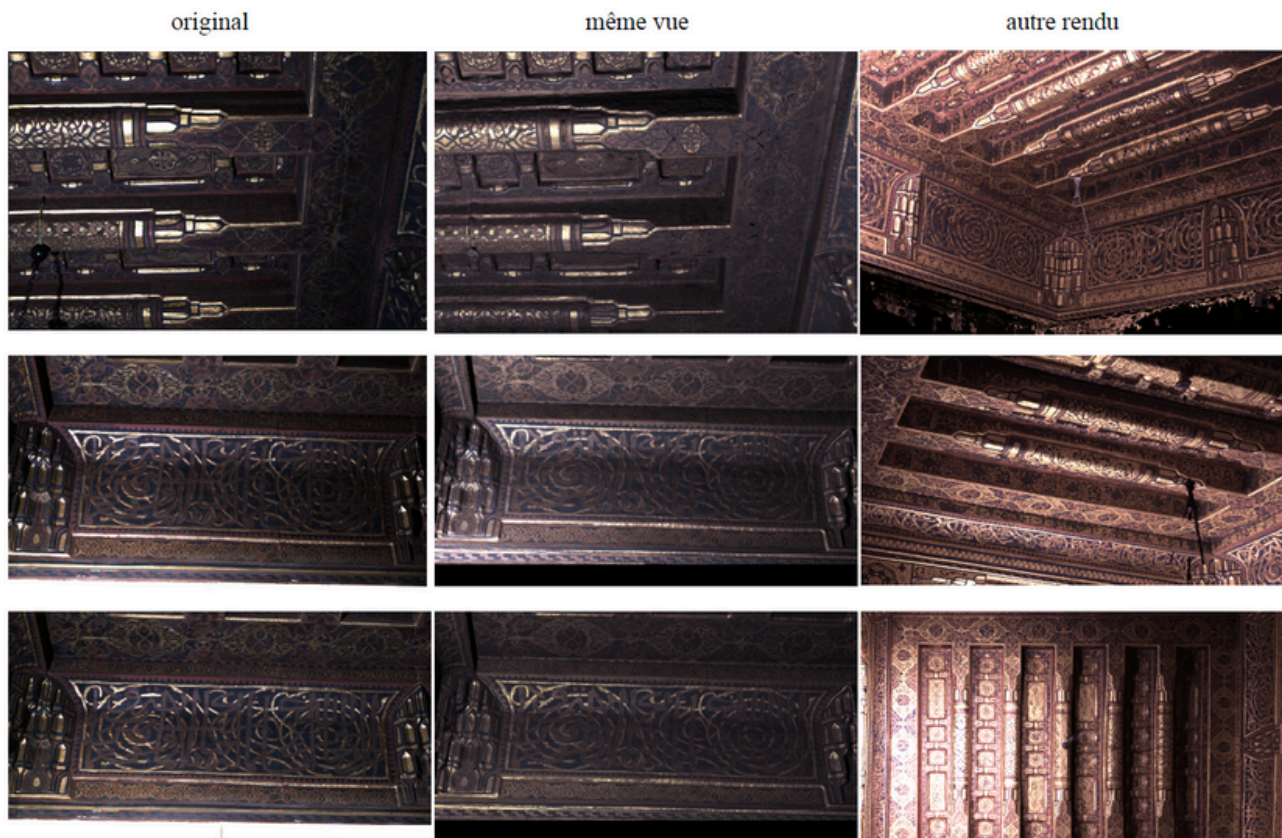
Figure 3 : Comparaison, sur un plafond de l'ambassade de France au Caire, entre les photographies d'origine (à gauche) et re-calculé avec notre mesure de SVBRDF (en centre). À droite, un nouveau point de vue a été généré.

Ce travail a été financé par le projet SMART 3D (financement MITI CNRS 80 prime) et supporté par le projet Tremplin CNRS \mu ChaOS. Il a été réalisé dans le cadre de la thèse de Corentin Cou [9] à qui cette communication est dédiée.