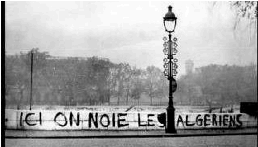
« ICI ON NOIE LES ALGÉRIENS ».