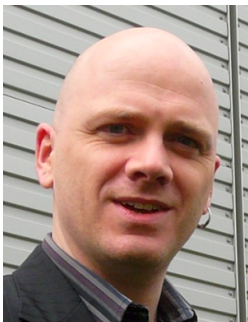
Président de Bayesia