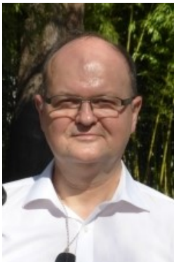
Président de l'Afia