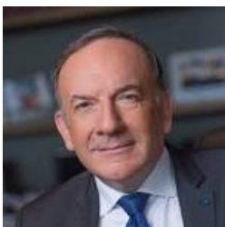
Président du MEDEF

Élu président du MEDEF le 3 juillet 2013, Pierre GATTAZ s'est fixé une priorité : développer l'emploi en donnant aux entreprises les moyens et les conditions d'être compétitives dans un environnement de confiance, seule façon de restaurer la croissance indispensable au redressement de l'économie de notre pays.