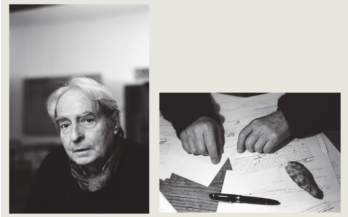
Le visage et les mains du poète André du Bouchet photographiées par Hannah Assouline.