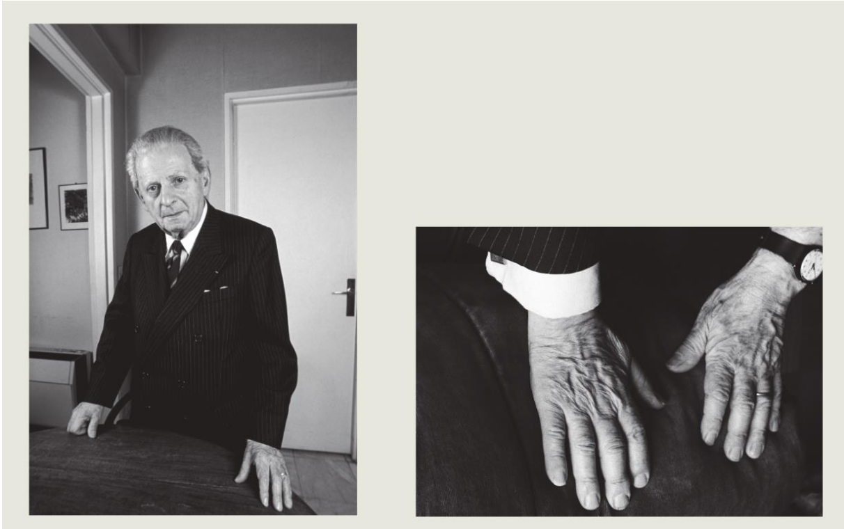
Le visage et les mains du philosophe Emmanuel Levinas photographiées par Hannah Assouline.