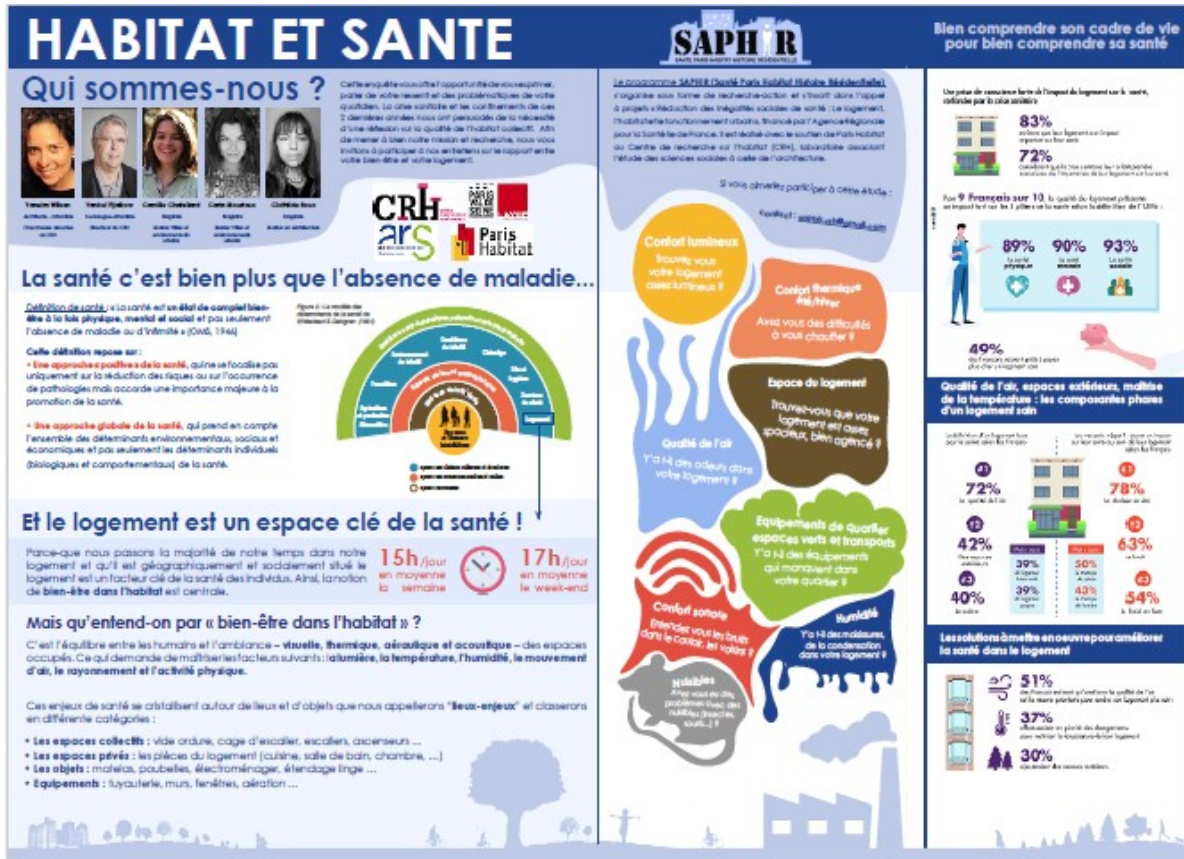
Figure 2. Affiche A0 préparée pour les cafés pédagogiques

nous présentons aux habitants qui veulent bien s'arrêter l'impact de la qualité du logement sur la santé physique et mentale, au moyen d'une affiche didactique (figure 2). Ces moments visent à rendre les habitants attentifs à ces questions en les associant, comme participants volontaires, à l'enquête.