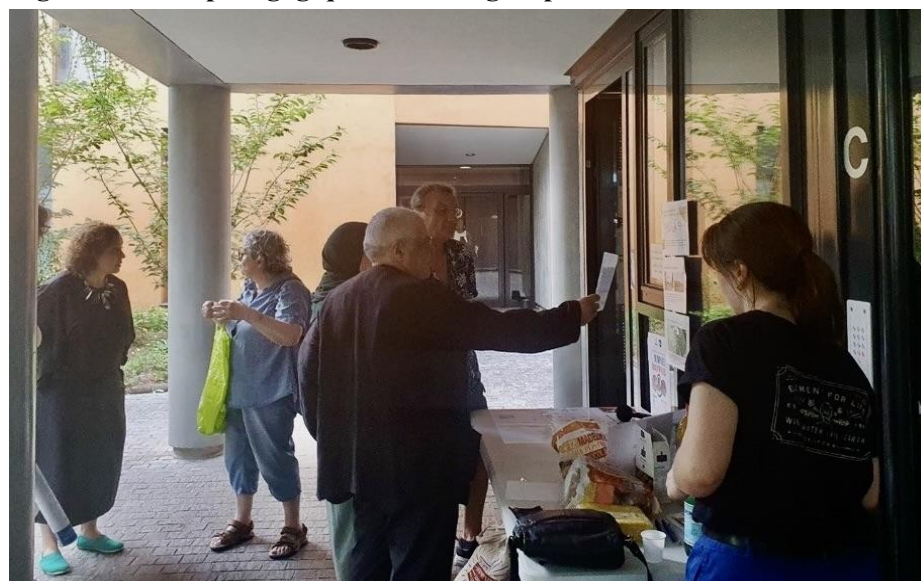
Figure 4. Cafés pédagogiques et focus group, Paris 13 e

Cette méthode permet d'élaborer, à l'échelle de l'immeuble et de l'appartement un diagnostic qualitatif, et de déplier la littératie des habitants – ce qui transpose les apports de Sørensen (2012) et de Tronto (2015) dans l'habitat. Nous aboutissons à des typologies d'habitants : les actifs et les inactifs, avec à chaque fois trois sous-catégories (expert, profane ou résigné) selon la capacité à gérer ou non les problèmes rencontrés concernant la qualité de l'habitat et l'influence sur la santé.