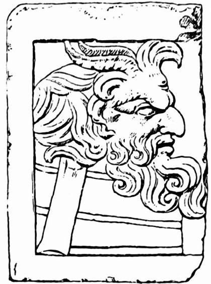
Figure 14 Fragment de plaque ( pinax ) représentant Polyphème. Musée de Dresde. Dessin V. Vassal d'après Pailler 1982 : 135 fig. 4-5.

Le Cyclope n'a qu'un œil, il ne peut pénétrer le voile de l'ignorance et s'élever malgré sa dimension de fils de dieu. Il est contraint à vivre dans les ténèbres de la grotte 37 . Détruire l'œil du géant signifie annihiler les instincts qui brouillent la vue afin de reprendre le contrôle, c'est-à-dire la dikê (la justice, le droit, l'usage