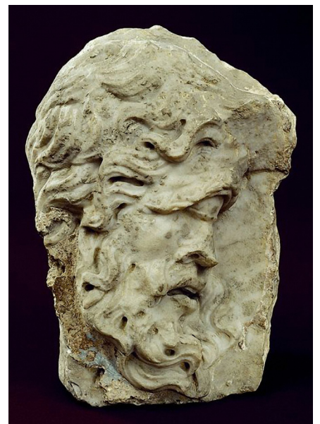
Figure 15 Fragment d'une plaque représentant Polyphème de profil. Musée Thorwaldsen.