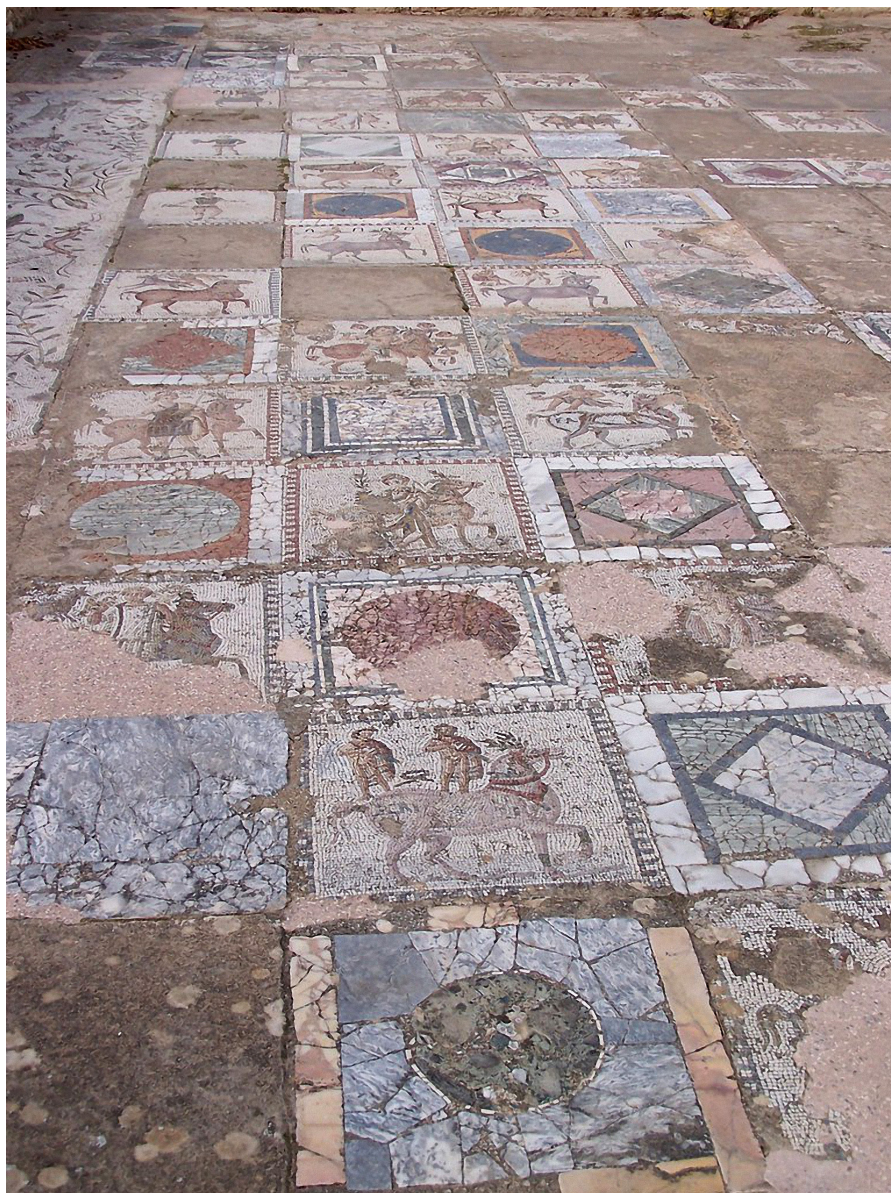
Figure 9 Mosaïque aux Chevaux de Carthage.

Mais l'aventure d'Ulysse ne s'arrête pas là : l'ultime partie de l'histoire est celle de la fuite des Grecs sous les béliers. Malgré la cécité du Cyclope, Ulysse et ses compagnons ne peuvent sortir de la grotte dont l'ouverture est fermée par un énorme rocher. La seule opportunité pour l'équipage serait de partir avec les ovidés que Polyphème laisse paître tous les matins. Ulysse attache alors trois bêtes ensemble, en liant un compagnon sous le ventre du bélier central de chaque groupe. Mais le Cyclope n'ayant aucune intention de libérer ses prisonniers, palpe le dos des animaux afin de vérifier qu'aucune victime ne s'évade. Un à un les membres de l'équipage réussissent à sortir. L'idée de cette ingénieuse fuite, mise en place par la métis d'Ulysse, a vivement attiré les peintres grecs puisqu'il en existe de nombreuses représentations sur des céramiques (Shapiro 1994 : 11-45) ; mais les artistes ont également fixé cet épisode sur des lampes, des reliefs, des urnes cinéraires, des sculptures (Fig. 10) (Touchefeu-Meynier 1992a - 1992b). Le nombre important de cet épisode relayé sur différents supports montre la célébrité du modèle original et sa large diffusion dans l'art romain. On en rencontre cependant qu'un seul exemple sur une mosaïque de Baccano (Fig. 11), réalisée vers 200 avant J.-C. (Beccatti 1970 : 28-29 pl. XI ; Museo Nazionale Romano 2012 : 157-158 n° 22.3.17, 281). Polyphème n'a pas d'œil