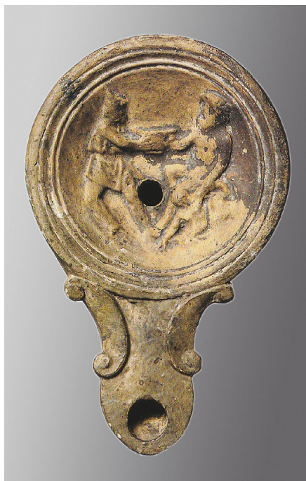
Figure 3 Lampe romaine, milieu du I er siècle après J.-C. Conservée à la BNF, Monnaies, Médailles et Antiques.