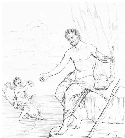
Figure 12 Dessin d'après une peinture d'Herculanum in Raccolta delle più interessanti dipinture e de' più belli mosaici rinvenuti negli scavi di Ercolano . Naples 1843 : pl. 26.

frontal, mais possède deux orbites blanches où l'on aperçoit deux pupilles noires dirigées de côté, alors que les yeux devraient être dirigés vers le bélier qui, lui, a un regard bien discernable, comme celui d'Ulysse. Subtilement le mosaïste suggère la cécité du Cyclope par cette étonnante représentation. Le géant tâte le bélier avant de le laisser sortir et c'est précisément le fils de Laërte qui apparaît sous le ventre de l'animal, agrippé à sa toison. Cette scène semble être traitée par juxtaposition d'aplats de couleur à la manière d'une peinture 26 , des bandes colorées figurant le sol, d'autres, organisées dans un mouvement centripète, avec effets de matière, évoquent l'entrée rocheuse de la grotte 27 . Le traitement perturbe le regard et la clarté de la toison du bélier concentre notre attention sur l'animal et la figure d'Ulysse.