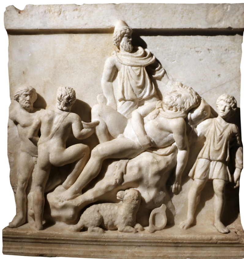
Figure 8 Face latérale d'un sarcophage conservé au musée civique de Catane, II e siècle après J.-C.

col énorme, et le sommeil le prend, invisible dompteur ». Voir également pour l'analogie de la position du corps de Polyphème, la face latérale d'un sarcophage conservé au musée civique de Catane, daté du II e siècle après J.-C.