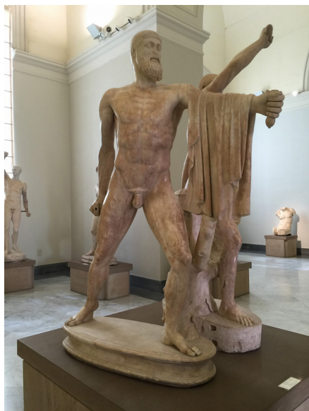
Figure 6 Les Tyrannoctones. Musée archéologique de Naples.