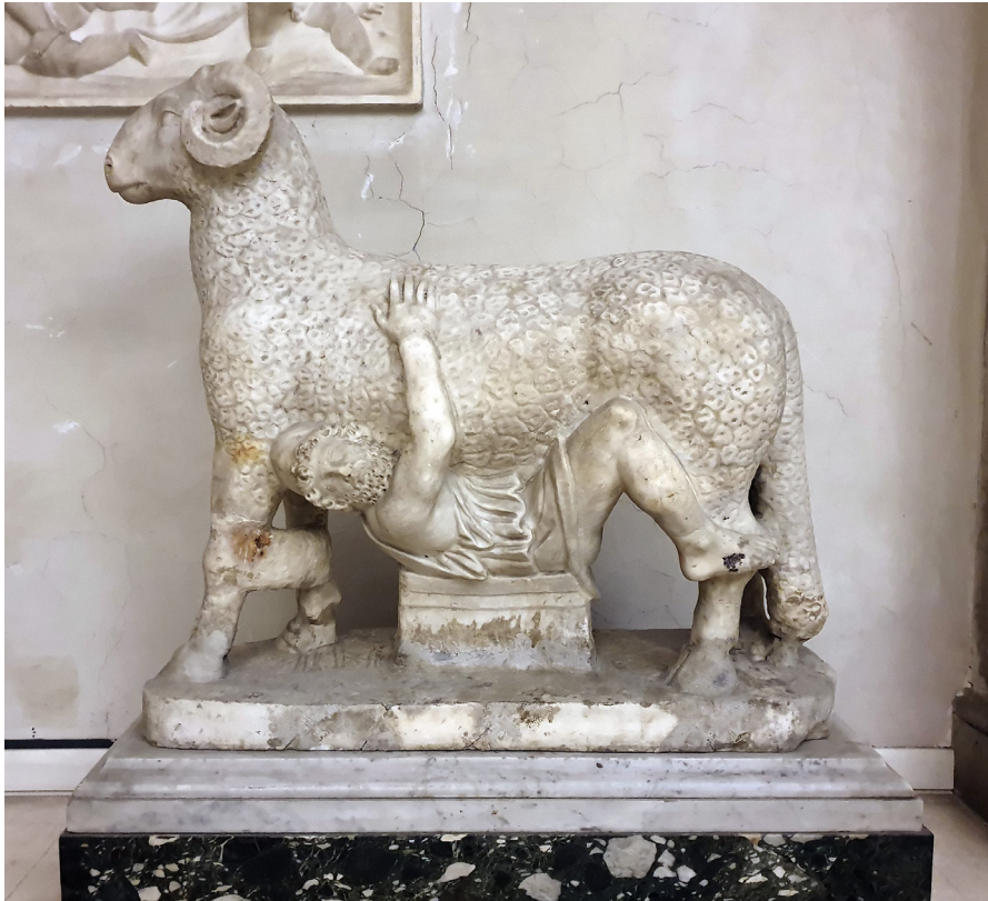
Figure 10 Ulysse sous le ventre du bélier, Galerie Doria-Pamphilj, Rome, II e siècle après J.-C.