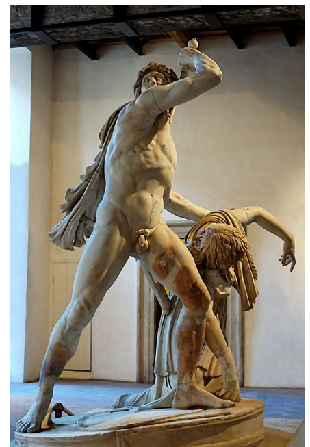
Figure 5 Groupe Ludovisi. Musée National Romain – Palais Altemps, Rome.