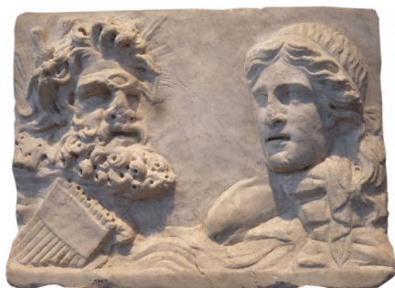
Figure 13 Polyphème et Galatée, plaque du Musée National Romain conservée au Palais Massimo des Thermes, Rome.

Sur la mosaïque de la Domus Aurea , le Cyclope est doté d'un œil frontal et probablement de deux yeux clos ; sur celle de Baccano, Polyphème est représenté avec deux yeux d'aveugle ; sur les mosaïques de Piazza Armerina et de Carthage, le géant possède trois yeux. On peut mettre en parallèle à ces éléments iconographiques le dessin d'une peinture d'Herculanum 29 où le Cyclope reçoit une tablette de Galatée (Fig. 12), des reliefs 30 et plusieurs plaques rectangulaires ( pinakes ) 31 . Sur l'une de ces dernières conservées au Palazzo Massimo de Rome, le Cyclope possède trois yeux, un nez épaté, des cheveux piqués d'aiguilles de pin qui l'assimile à un satyre, ce que souligne la syrinx (Fig. 13 ; Pailler 1971 : 136). Sur quelques exemples cités précédemment, Polyphème n'est plus le dévoreur de chair humaine, mais l'amoureux transi de la Néréide. Les traits du visage du géant s'humanisent puisqu'il est capable d'aimer. D'après une hypothèse, la présence des trois yeux serait liée « à la prépondérance, depuis les temps hellénistiques, de l'art du relief [...] ; l'œil unique eût été vraiment difficile à modeler en sculpture » (Touchefeu-Meynier 1968 : 75). Cette hypothèse se justifie surtout pour les masques de profil où le troisième œil, seul, n'est pas lisible, comme en témoigne J.-M. Pailler dans son étude sur le pinax de Dresde (Pailler 1971 : 134 fig. 3) : « A s'en tenir aux descriptions publiées [...] le front du masque de Dresde n'est en effet barré que