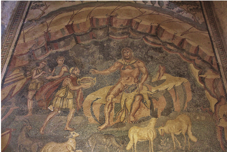
Figure 4 Mosaïque, Ulysse dans l'antre de Polyphème. Piazza Armerina, Villa del Casale, pièce 37, IV e siècle.