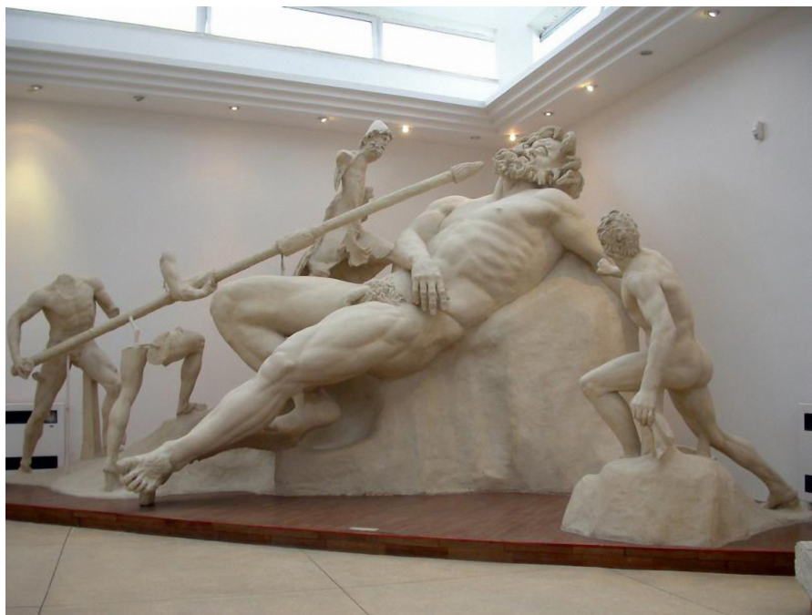
Figure 7 Groupe de Polyphème provenant de la grotte de Tibère. Proposition de restitution. Musée archéologique national de Sperlonga.