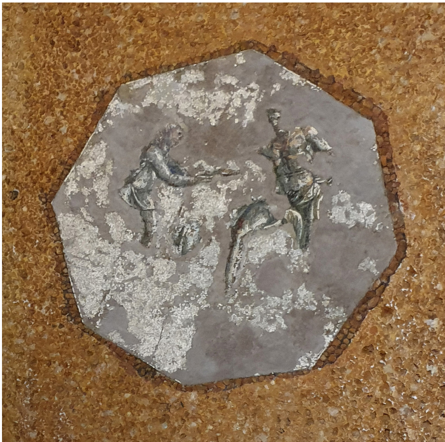
Figure 2 Octogone central de la voûte du nymphée de la Domus Aurea .

La première mosaïque sur laquelle apparaît l'épisode d'Ulysse et du Cyclope est celle provenant de la voûte du nymphée de Néron dans la Domus Aurea , datée au I er siècle après J.-C. La scène représentée précède l'aveuglement : Ulysse invite Polyphème à boire le vin d'Ismaros qui va l'enivrer : « ce vin de liqueur ; sans une goutte d'eau, c'était boisson de dieu [...] » (Hom.Od. IX, 204-205). Cette mosaïque est décrite et largement commentée dans l'article le Nymphée au Polyphème de la Domus Aurea (Lavagne 1970). Sur la mosaïque, en proie à la crainte que lui inspire le Cyclope, Ulysse semble avancer à pas feutrés, sa jambe droite prête à faire volte-face au moment même où il offre le vin à Polyphème (Fig. 2). D'après le texte d'Homère, Ulysse doit se rapprocher du Cyclope, à trois reprises : « je lui remplis son auge de vin aux sombres feux ; trois fois, j'apporte l'outre, et trois fois, comme un fol, il avale d'un trait » (Hom.Od. IX, 360-363).