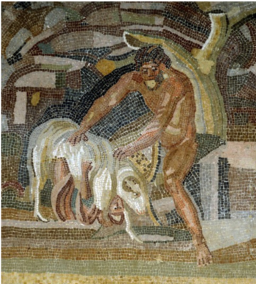
Figure 11 Emblema représentant Ulysse et Polyphème. Villa des Sévères, Baccano. Musée National Romain – Palais Massimo des Thermes.