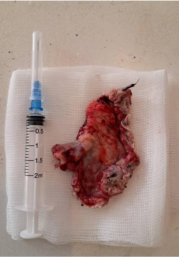
Figure C : Fin de l'exérèse