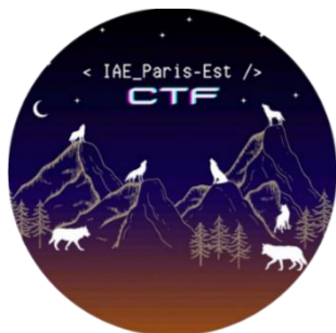
Figure 1. Logo de l'équipe CTF pédagogique de l'IAE Paris-Est.

la réalisation du défi « Bandit » sur la plateforme OverTheWire 6 . Ainsi, grâce à ce socle de connaissances, chaque membre de l'équipe est maintenant armé pour aider et soutenir la progression de chaque membre du parcours.