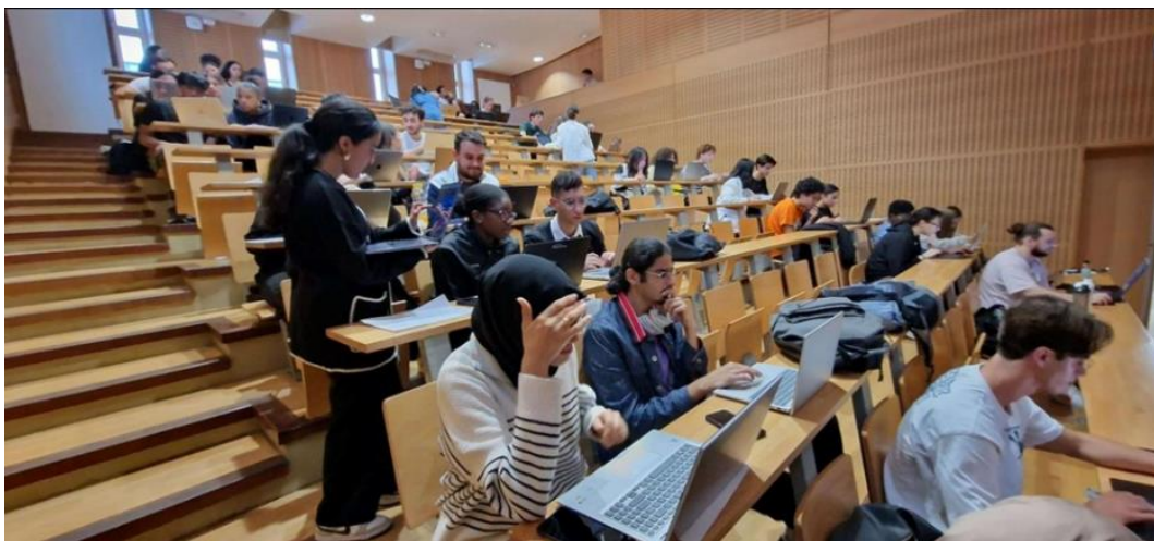
Figure 3. Photo du premier CTF organisé par l'équipe CTF pédagogique de l'IAE Paris-Est.

d'une équipe de quatre personnes. Nous avons choisi ce nombre de participants par équipe, car nous avons remarqué que lorsque nous proposons des défis complexes ou longs, les participants créaient d'eux-mêmes des équipes de trois ou quatre personnes, l'inertie dans l'équipe que ce petit nombre provoque est parfait et c'est exactement ce que nous recherchons. Les participants qui terminaient les premiers recevaient un diplôme honorifique et une médaille, de plus tous les participants recevaient une récompense pour accentuer le levier de la récompense et éviter un clivage. Et cela a permis de revoir ces participants aux autres événements que nous avons organisés. À la suite de ce défi, nous avons fait remplir un questionnaire aux participants afin de récolter leur ressenti sur la difficulté, l'organisation, l'accompagnement et surtout les compétences qu'ils ont découvertes. Cela nous a permis de mettre en place un atelier de découverte d' Osint afin de répondre au besoin identifié à la suite de ce défi. Par ailleurs, afin d'aider les débutants, nous avons rédigé un feedback pédagogique assez simple et complet expliquant la logique du défi et les compétences travaillées.