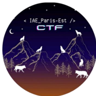
Figure 1. Logo de l'équipe CTF pédagogique de l'IAE Paris-Est.

la réalisation du défi « Bandit » sur la plateforme OverTheWire 6 . Ainsi, grâce à ce socle de connaissances, chaque membre de l'équipe est maintenant armé pour aider et soutenir la progression de chaque membre du parcours.