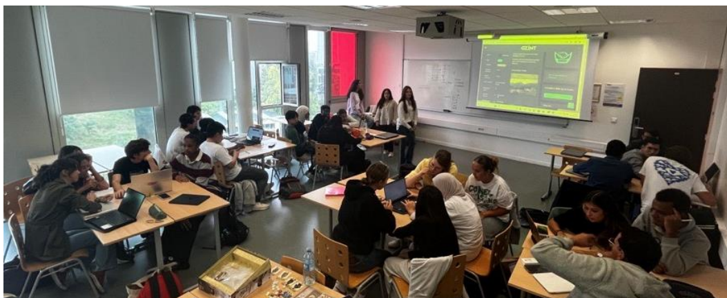
Figure 2. Un premier CTF a été organisé dès la semaine de pré-rentrée fin août pour les nouveaux bacheliers intégrant la Licence du Parcours Informatique & Management.

suivi pour la réalisation du défi « Bandit » de la plateforme Overthewire 7 . Nous l'avons choisi, car il permet d'obtenir les bases en langage Bash 8 et permet de découvrir comment naviguer sur un terminal Linux, très utilisé dans les compétitions de cybersécurité. Cela a permis, de faire découvrir les défis de types Jeopardy à tous les étudiantes et étudiants de la formation et de leur donner les bases nécessaires à la réalisation de presque tout CTF. Tous les membres de l'équipe CTF pédagogique se sont rendus disponibles, et nous avons dû répondre en moyenne à quinze questions par jour. De plus, pour les débutants, nous avons réalisé une vidéo et une conférence pour la réalisation du tout premier niveau de ce défi afin qu'ils aient toutes les cartes en main pour commencer. Les questions posées tout au long de cette semaine ont permis la réalisation d'un feedback pédagogique très précis et personnalisé (Annexe 1) permettant de répondre à chaque question que se posaient les membres de la formation. Nous avons collecté des retours sur ce feedback qui étaient très positifs. Cependant, nous devons insister sur le contexte du CTF afin de bien délimiter les compétences travaillées du défi.