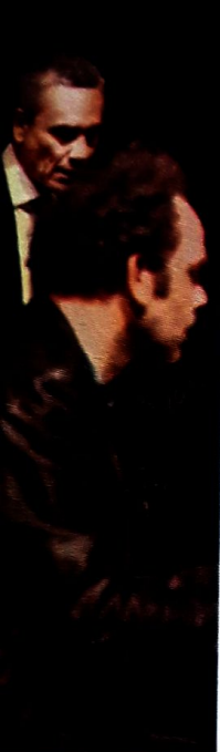
دشمن مردم ایسن

۸. متولد ۱۹۵۱، کارگردان سوئیسی تئاتر و اپرا