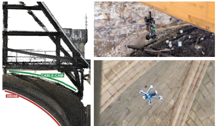
Figure 1. Instrumentation utilisée pour la numérisation de l'intrados et de l'extrados des voûtes de Notre-Dame de Paris après l'incendie.

Ces deux techniques complémentaires ont ainsi permis de contourner les contraintes de la numérisation de cet espace essentiel de la cathédrale après l'incendie.