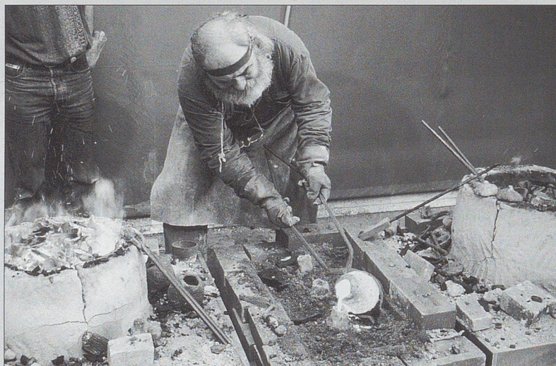
Coulée de bronze restituant l'ambiance d'un atelier gallo-romain tel celui présenté à Augst (Suisse, Augusta Raurica).

L'archéologue va ainsi disposer de l'histoire interne des objets et pouvoir esquisser l'histoire des débuts de la métallurgie dans les différentes régions du monde.