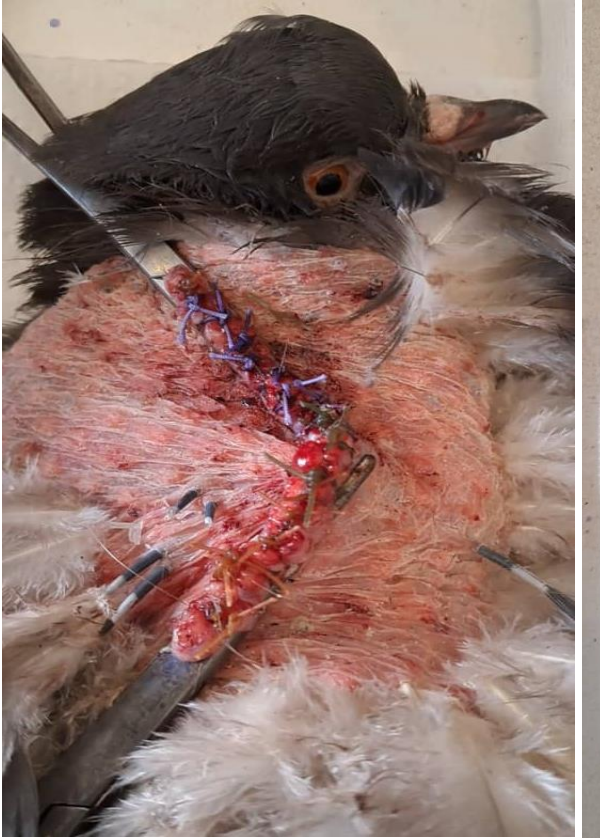
Figure C : Synthèse