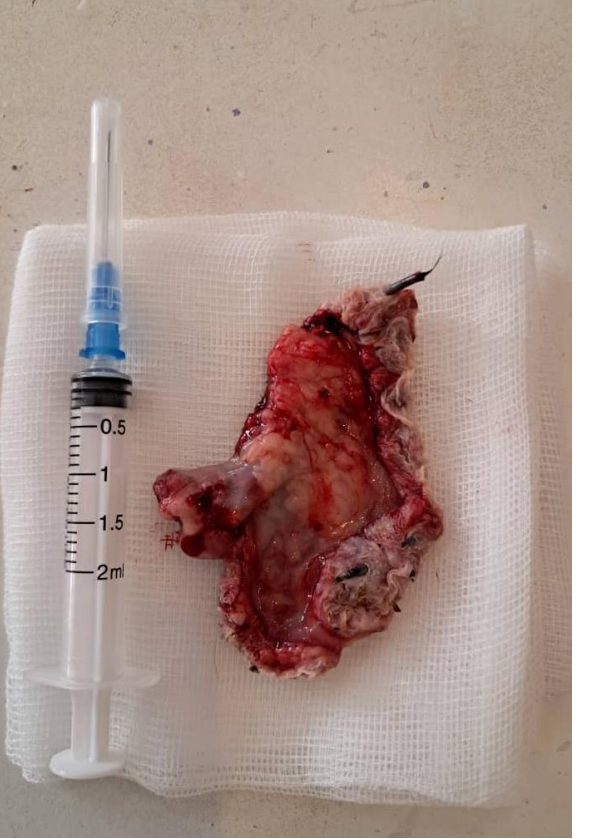
Figure C : Fin de l'exérèse