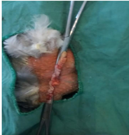
Figure B : Pose des pinces coprostase