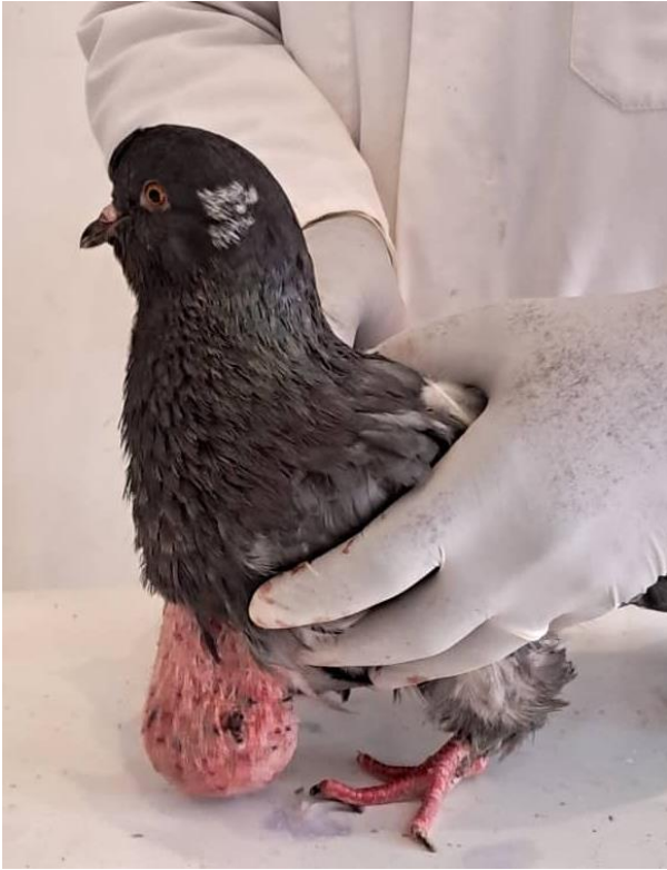
Figure A : Ptose du jabot avec lésions des ongles