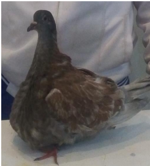
Figure A : Ptose du jabot