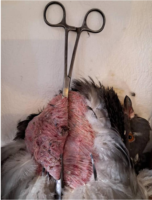
Figure B : Pose des pinces coprostase