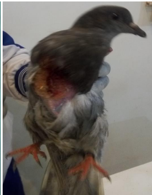
Figure C : Fin de l'exérèse