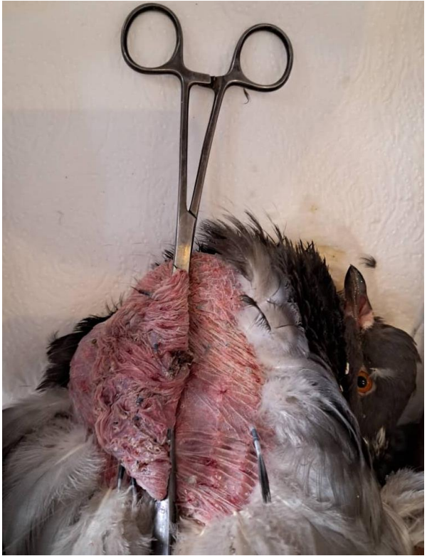
Figure B : Pose des pinces coprostase