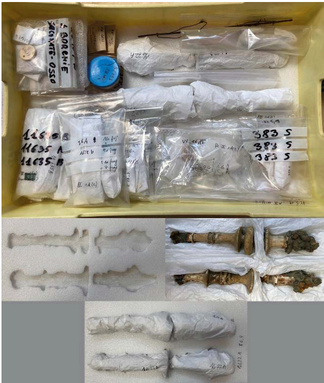
A. Cormier, sur concession du MiC – PA Pompei. Tous droits réservés.