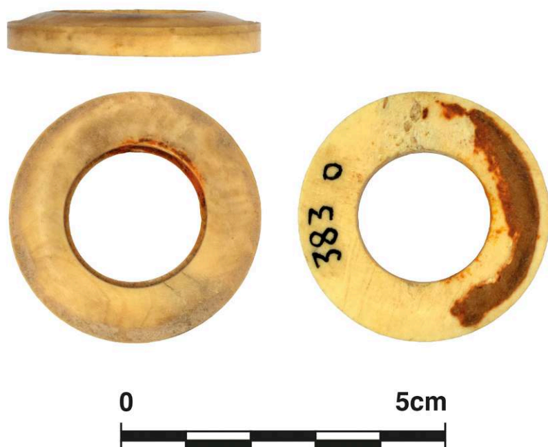
Fig. 7. Élément annulaire de montant de meuble, os, de Pompéi, Casa dei Fiori VI 5, 19, dépôts du site ( Casa Bacco ), inv. 383.O.