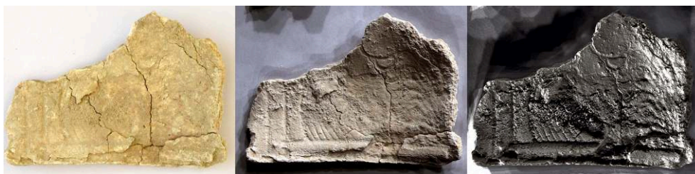
Fig. 1. Fragment de stuc à motifs décoratifs incisés, lit funéraire 39408, nécropole septentrionale de Cumes, monument E39, sépulture SP39207.