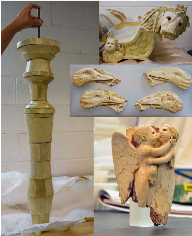
Fig. 13. Éléments en ivoire et en os des lits de Aielli (Abruzzes), tombes I, II et IV.