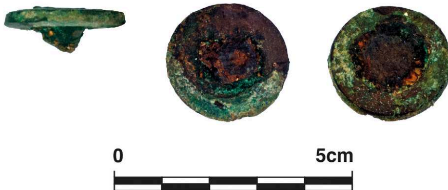
Fig. 11. Base de montant de lit, alliage cuivreux / fer, de Pompéi, Casa dell'Ara massima VI 16, 15, dépôts du site ( Casa Bacco ), inv. 56021e.