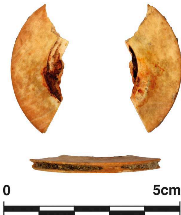
Fig. 12. Élément annulaire de montant de lit domestique, ivoire d'éléphant, de Pompéi, Casa dell'Ara massima VI 16, 15, dépôts du site ( Casa Bacco ), inv. 56021f.