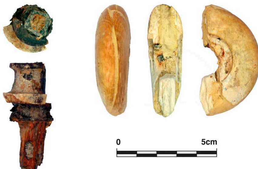
Fig. 10. Élément en forme de bobine et élément annulaire de montant de lit domestique, ivoire d'éléphant / fer / restes ligneux, de Pompéi, Casa dell'Ara massima VI 16, 15, dépôts du site ( Casa Bacco ), inv. 56021a et 56021b.