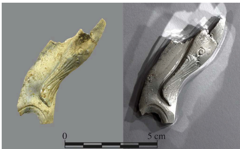
Fig. 2. Couronnement de fulcrum , os, nécropole septentrionale de Cumes, sépulture SP29050.