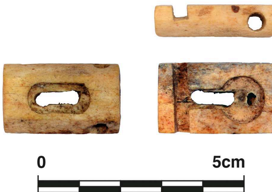
Fig. 6. Élément de serrure, os, de Pompéi, Casa dei Fiori VI 5, 19, dépôts du site ( Casa Bacco ), inv. 383.N.