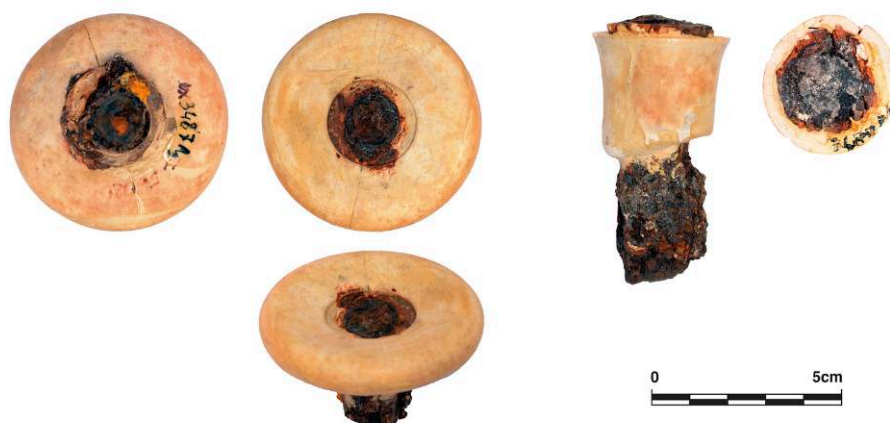
Fig. 9. Élément annulaire et élément tronconique de montant de lit domestique, ivoire d'éléphant / fer / restes ligneux, de Pompéi, Casa dell'Ara massima VI 16, 15, dépôts du site ( Casa Bacco ), inv. 56020a et 56020b.