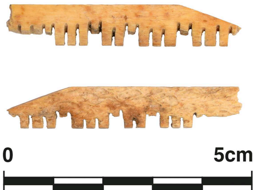
Fig. 8. Fragment d'applique en bandeau, os, de Pompéi, Casa dei Fiori VI 5, 19, dépôts du site ( Casa Bacco ), inv. 383.P.