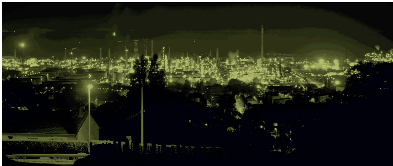
Fig. 1 : Vue de la ville de Port-Jérôme-sur-Seine. Derrière les maisons au premier plan, les usines brillent la nuit.