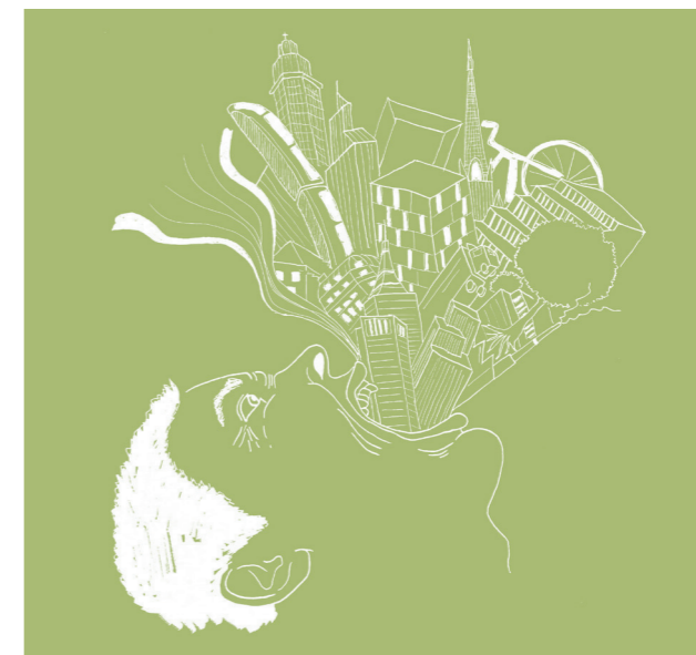
Fig. 4 : La coprophagie urbaine, dessin de l'auteur.