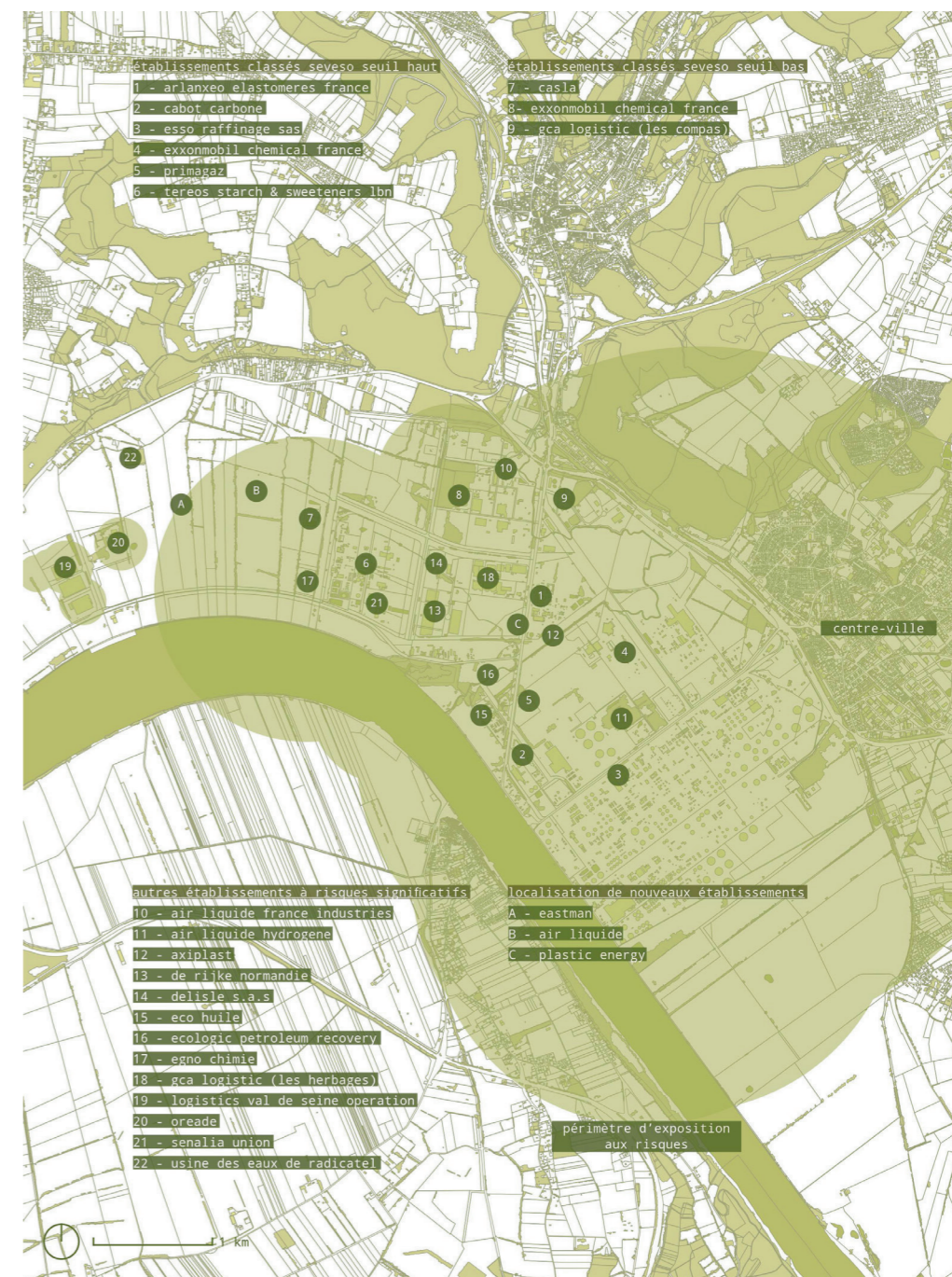
Fig. 3 : Carte de localisation des industries à Port-Jérôme, faite par l'auteur.