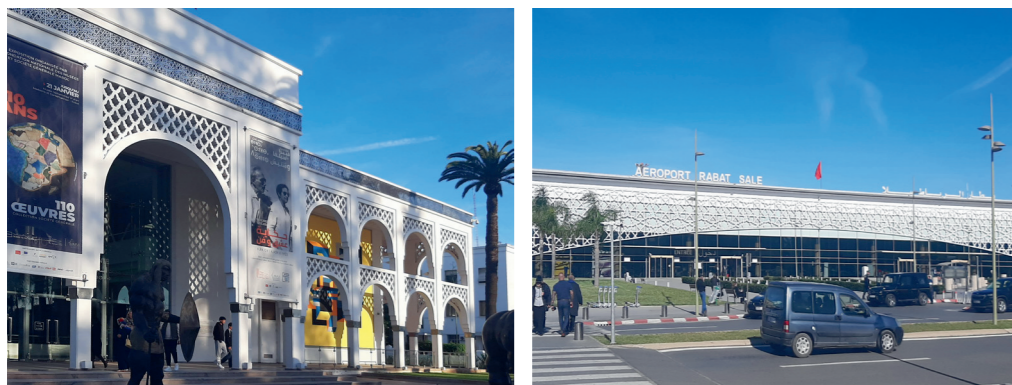
Fig 4 : Musée Mohamed VI d'Art moderne et contemporain, architecte Karim Chakor © Photo Nadya Rouizem, 2023.

retour aux sources arabo-musulmanes pour unifier un pays aux multiples ethnies berbères, et inscription dans une dynamique internationale de « modernité » et « d'innovation ».