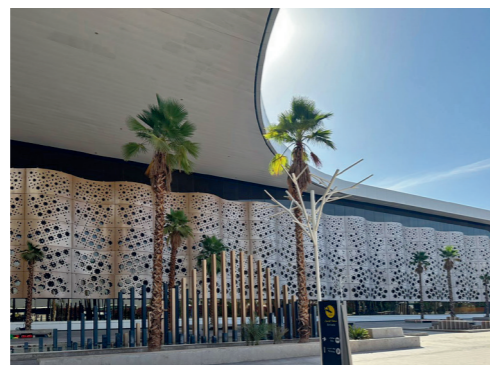
Fig 3 : Aéroport de Marrakech © Photos Tifawt Loudaoui, 2022.

Cette double référence aux motifs islamiques et aux moucharabiehs est reprise par de nombreux architectes, principalement dans le « style arabe international » mentionné précédemment. Cette tendance tend à homogénéiser excessivement le monde arabe et fait écho à la fameuse identité arabo-musulmane, souvent critiquée comme une forme d'orientalisme comme le souligne Mustapha El Qadery 30 .