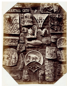
Fig 3 : Intérieur du Royal Architectural Museum à Tufton Street, 1872.