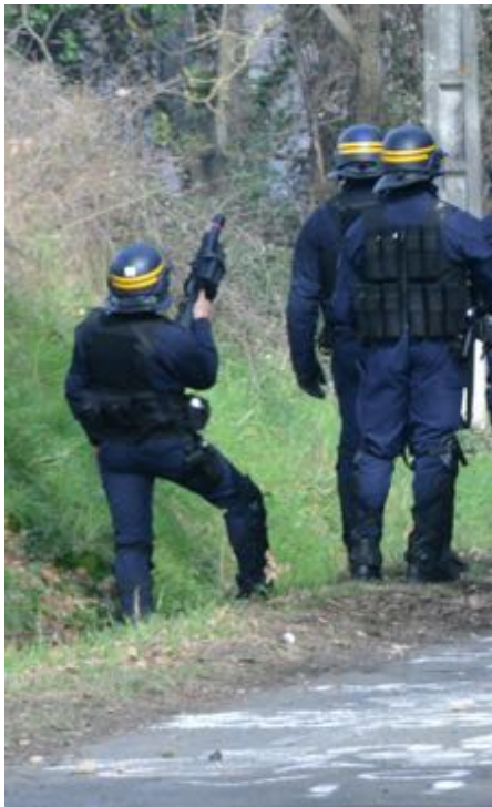
15 février – Un CRS avec un PGL 65.