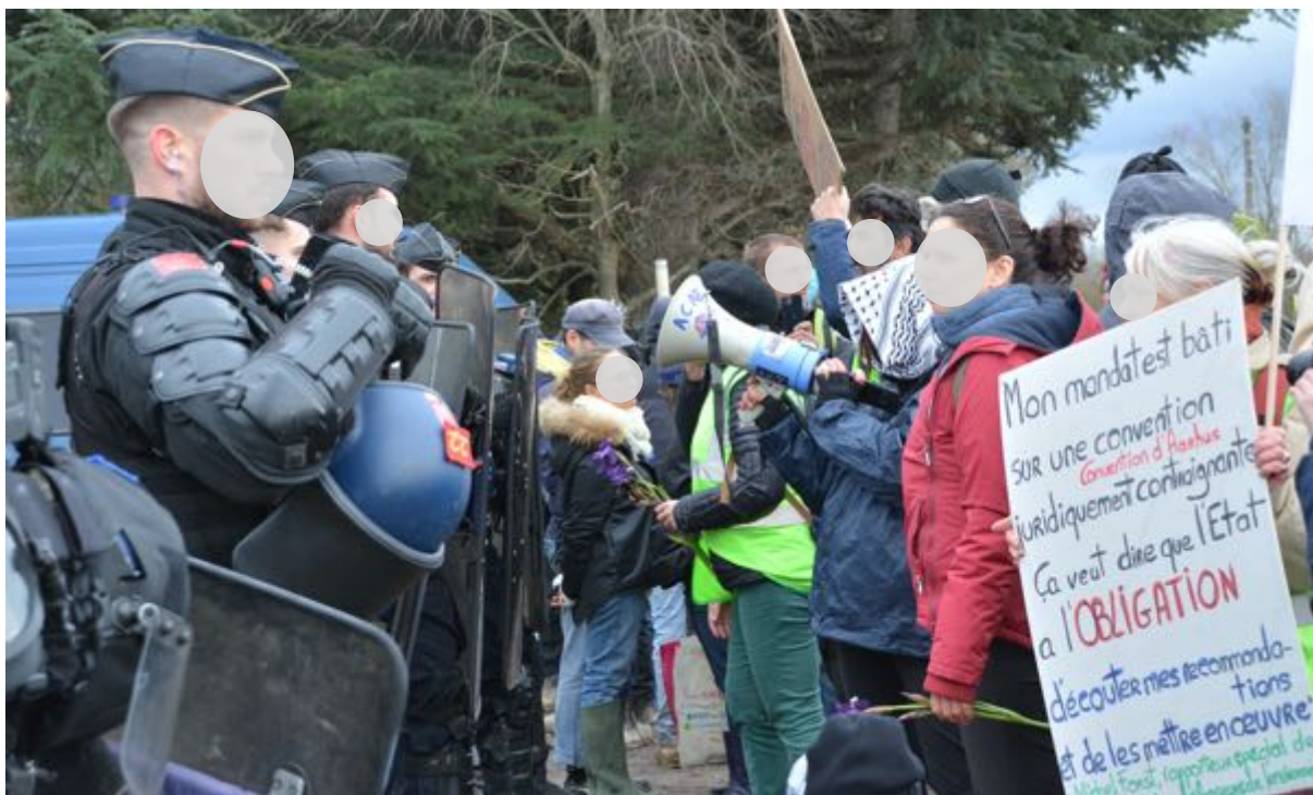
3 mars 2024 - Les soutiens aux écureuils face aux gendarmes. Leurs « armes » : pancartes, slogans, porte-voix et fleurs des champs...