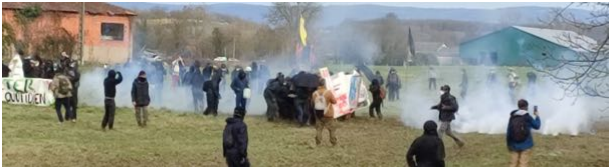
18 février 2024 - Certains manifestants sont organisés de manière un peu « classique » désormais avec du « matériel de protection », banderoles « renforcées » et parapluies, contre les grenades et projectiles de LBD.

Lors de certains épisodes, très rares en fait, nous avons constaté, de la part de certains opposants, des jets de pierre (le ballast de la voie ferrée n'est jamais très loin...) et, une fois en 18 présences sur site, l'utilisation d'engins incendiaires, des cocktails Molotov, au nombre de deux, lancés au niveau d'une haie bordant la voie ferrée.