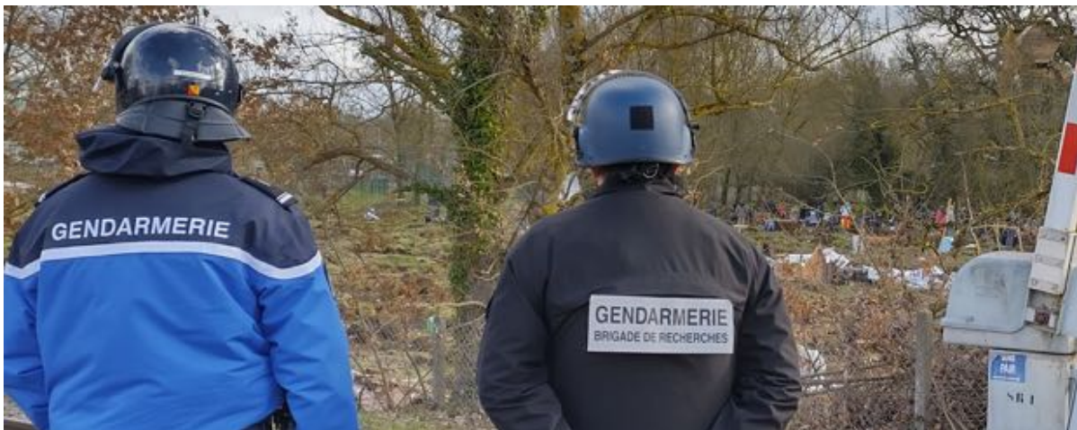
11 février 2024 - Ce qui est écrit dans le dos du gendarme de droite confirme la tendance, de plus en plus marquée, à la criminalisation des actions de désobéissance civile.