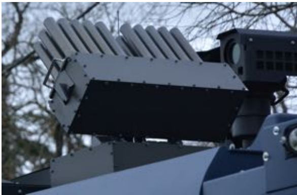
Les « orgues de Staline », dispositif capable de lancer 30 grenades en tous genres y compris des grenades explosives GM2L jusqu'à une distance de 200 m et bientôt 400...