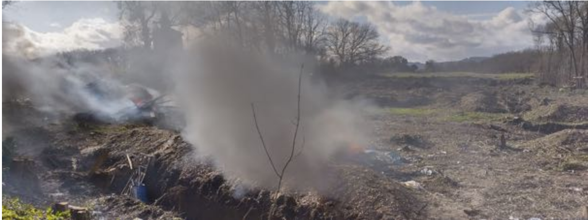
11 février – 15h09 – Fumées des brulis en direction des « écureuils » - Une volonté de les enfumer ?