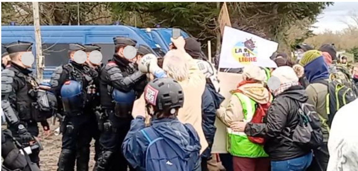
Parfois, les contacts sont un peu rugueux avec les soutiens... Image extraite d'une vidéo du 3 mars.

Lors des incidents qui ont marqué cette séquence, les observateurs ont constaté que les opposants, très divers, ont usé de moyens militants assez « traditionnels » : pancartes et banderoles, slogans et chants, échanges verbaux, plus ou moins tendus, quelques fois ironiques, avec policiers et gendarmes, utilisation de mégaphones pour communiquer avec les « écureuils ». Les opposants ont eu quelquefois des pratiques assez « classiques » que l'on retrouve souvent dans les pratiques non-violentes, qui consistent à aller au plus près, au contact, des rangs des policiers et gendarmes pour essayer de « forcer » le passage, en particulier pour tenter de porter du ravitaillement aux occupants. Ceci sans aucun autre équipement que pancartes et porte-voix.