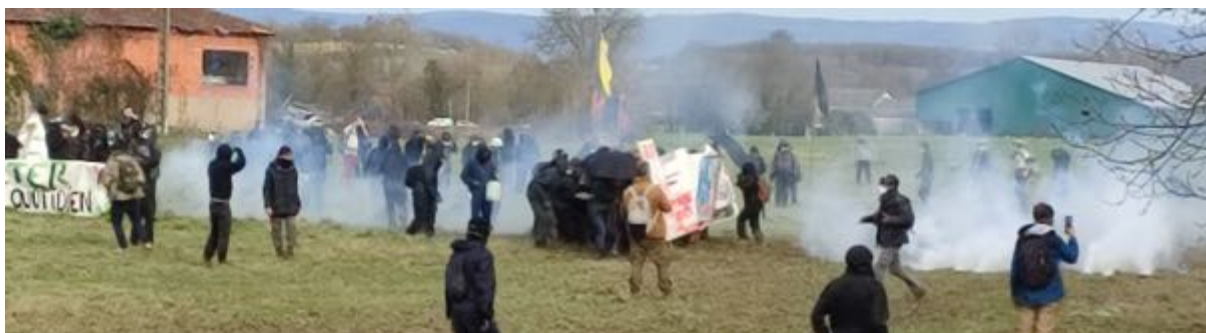
18 février 2024 - Certains manifestants sont organisés de manière un peu « classique » désormais avec du « matériel de protection », banderoles « renforcées » et parapluies, contre les grenades et projectiles de LBD.

Lors de certains épisodes, très rares en fait, nous avons constaté, de la part de certains opposants, des jets de pierre (le ballast de la voie ferrée n'est jamais très loin...) et, une fois en 18 présences sur site, l'utilisation d'engins incendiaires, des cocktails Molotov, au nombre de deux, lancés au niveau d'une haie bordant la voie ferrée.