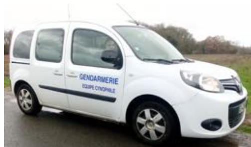
Et même la brigade cynophile...