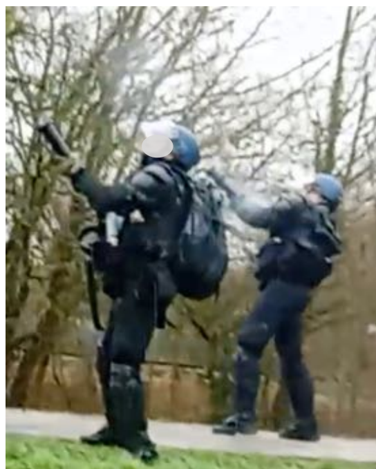
10 février 2024 - Tirs au cougar avec un angle de tir réglementaire (45°) et des DPR de 200 m.