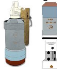
Grenade GM2L Lacrymogène et explosive