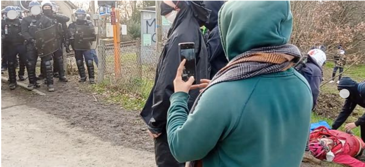
A droite de l'image, Intervention des secouristes volontaires. A gauche, les gendarmes. Aucun d'entre eux ne fera le moindre geste pour proposer une aide ; pourtant, les « opposants » présents ne présentaient aucun danger pour eux.

Les médecins la prennent en charge très rapidement (mise en position de sécurité) puis elle est évacuée sur un brancard... Elle est inconsciente. Les secouristes l'évacuent en urgence car une charge se prépare alors que, de notre point de vue, il n'y avait pas d'urgence à lancer cette opération au regard de notre observation du face-à-face entre les manifestant.e.s et les forces de l'ordre.