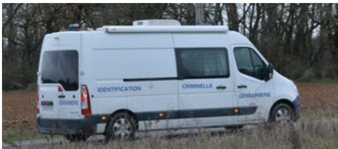
19 février 2024 - Un fourgon spécialisé de la gendarmerie.

Les observateurs ont aussi constaté la présence d'unités spécialisées dans la recherche criminelle. Les personnes qui occupent des arbres dans le cadre d'une action civile non-violente sont-elles donc des criminelles ?