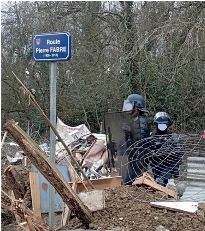
Gendarmes mobiles à Saix le 17 février 2024.

Ces modalités d'observation sont regroupées sous le terme de neutralité comportementale . Cette neutralité comportementale est au cœur du travail d'observation ; et les observateurs, sur le terrain, n'y ont jamais dérogé.