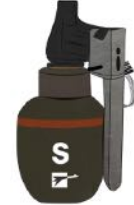
Grenade ASSD assourdissante

Les armes de la police et de la gendarmerie et leurs munitions.