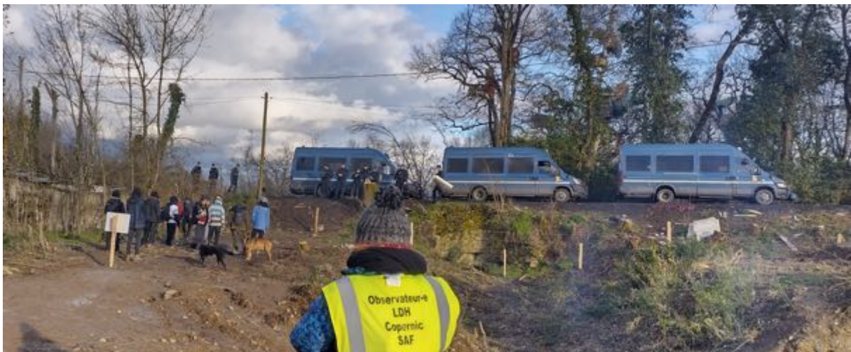
24 février 2024 – 17h17 au niveau du « trou » – Les fourgons de la gendarmerie positionnés pour faire obstacle à l'observation.

Cette restriction de la liberté d'observer est en contradiction avec les différents textes internationaux concernant les missions de documentation des observateurs indépendants. A titre d'exemple, dans un document de l'OSCE (Organisation pour la sécurité et la coopération en Europe - https://www.osce.org/fr ), le « Manuel de surveillance – Liberté de réunion pacifique », daté de 2020, il est fait référence au « Rapport du rapporteur spécial de l'ONU sur le droit à la liberté de réunion pacifique et d'association » daté du 13 août 2007 dans lequel il est précisé :