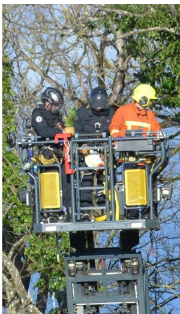
19 février 2024 - La nacelle des pompiers en action avec des gendarmes qui vont intervenir à la tronçonneuse dans la futaie puis commencer à démonter une cabane perchée.