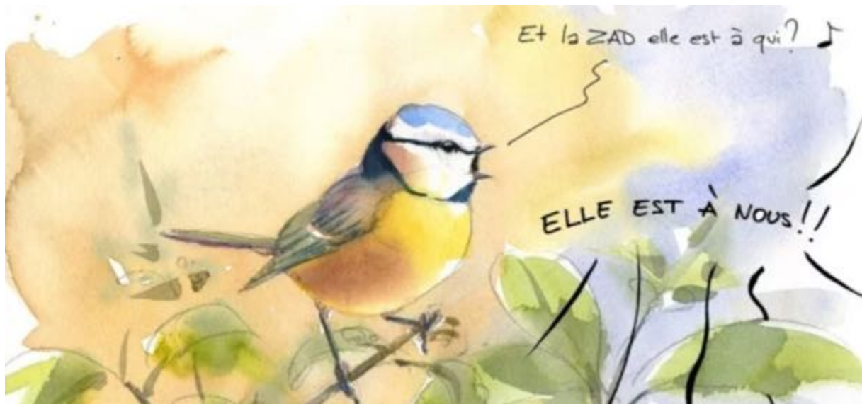
Illustration : Alessandro Pignocchi

Extrait du média en ligne « Reporterre » du 27 mars 2024.