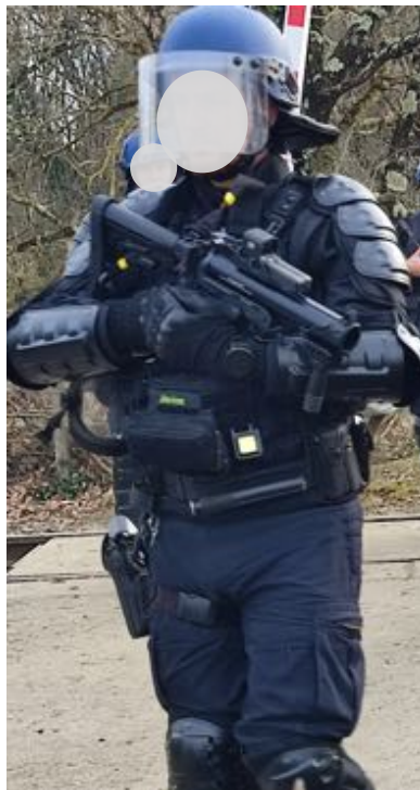
18 février – Un gendarme avec un LBD « dernier cri » et un autre avec un Cougar.