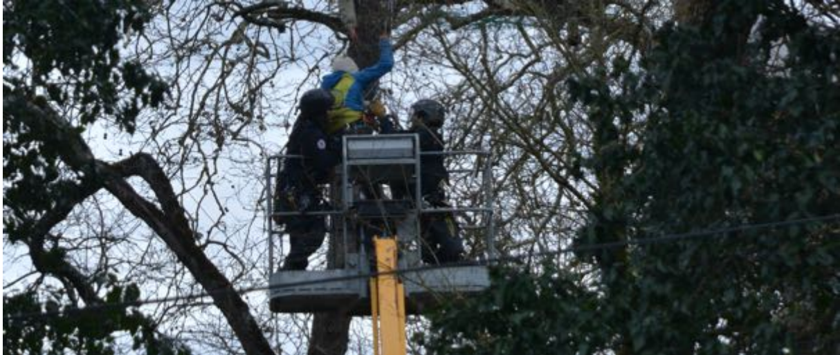
22 février 2024 – 13 h59 – Interpellation musclée d’un « écureuil ».

Il s’agit clairement d’une stratégie de « pourrissement » basée sur le maintien d’une pression constante couplée avec des actions ponctuelles visant à dégarnir les rangs des écureuils par des interpellations, relativement musclées comme celle effectuée lors de la venue du rapporteur de l’ONU, et par « abandon » de l’occupation par certains des écureuils pour des raisons de santé ou de fatigue.