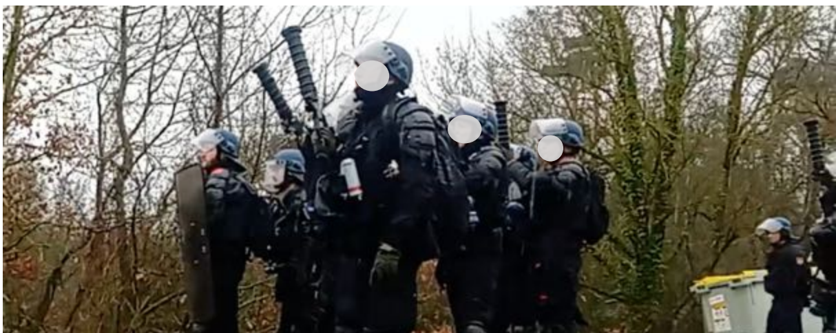
10 février 2024 – Les gendarmes s'appropriant à tirer avec 4 lanceurs Cougar utilisés simultanément.