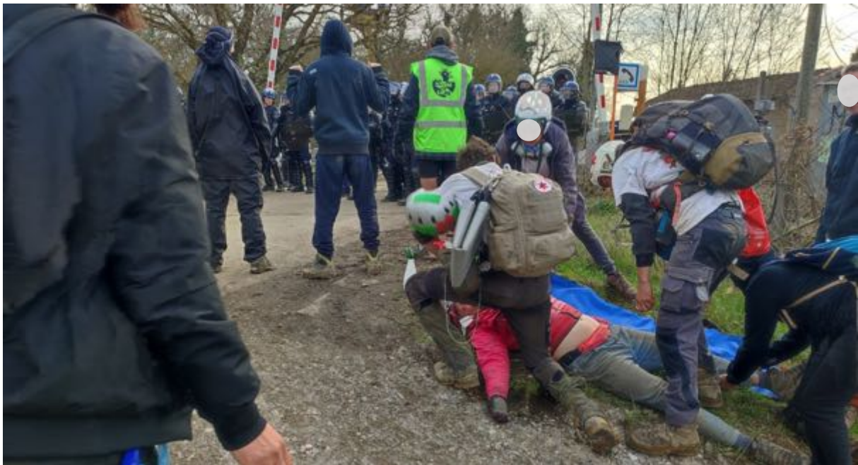
Les secouristes volontaires se préparent à évacuer la personne blessée pour la mettre à l'écart.

Les médecins la prennent en charge très rapidement (mise en position de sécurité) puis elle est évacuée sur un brancard... Elle est inconsciente. Les secouristes l'évacuent en urgence car une charge se prépare alors que, de notre point de vue, il n'y avait pas d'urgence à lancer cette opération au regard de notre observation du face-à-face entre les manifestant.e.s et les forces de l'ordre.