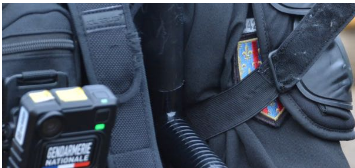
3 mars 2024 – A droite, au-dessus de l'écusson, un n° d'identification du RIO visible que de manière partielle.

Depuis la création de l'OPP il y a sept années maintenant et au vu de plus de 250 observations, nous considérons que les gendarmes portaient sensiblement plus leur matricule RIO que les policiers. Sur la base de nos observations à Saix en ce début 2024, nous devons reconsidérer notre position. Tout au long de nos présences sur site, nous avons constaté que nombre de gendarmes (quelquefois la moitié d'entre eux) ne portaient pas leur RIO ou bien ne le portaient pas de manière visible. Les photos ci-dessous, parmi des centaines prises à Saix en ces mois de février et de mars, en sont l'illustration.