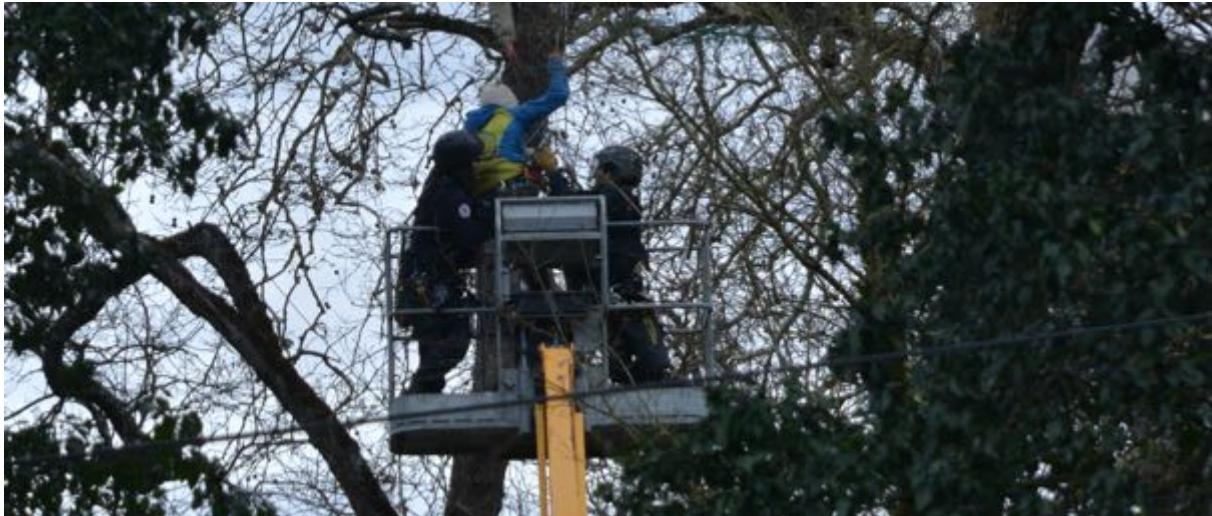
22 février 2024 – 13 h59 – Interpellation musclée d’un « écureuil ».

Il s’agit clairement d’une stratégie de « pourrissement » basée sur le maintien d’une pression constante couplée avec des actions ponctuelles visant à dégarnir les rangs des écureuils par des interpellations, relativement musclées comme celle effectuée lors de la venue du rapporteur de l’ONU, et par « abandon » de l’occupation par certains des écureuils pour des raisons de santé ou de fatigue.