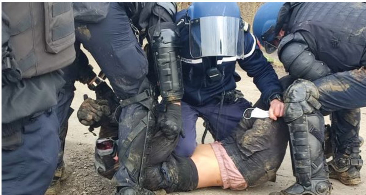
Interpellation musclée d'une personne – Au centre, un colonel de la gendarmerie avec le genou sur le thorax d'une personne interpellée.

16h - Devant nous, au niveau du passage à niveau, grosses charges en 2 fois (15 à 20 gendarmes et CRS) pour interpellations musclées de 5 personnes (clef de bras plus haute que les épaules, plaquages au sol, genoux sur thorax pour un) trainées derrière un rideau de FDO. Une sixième personne aurait été également interpellée (non observé).