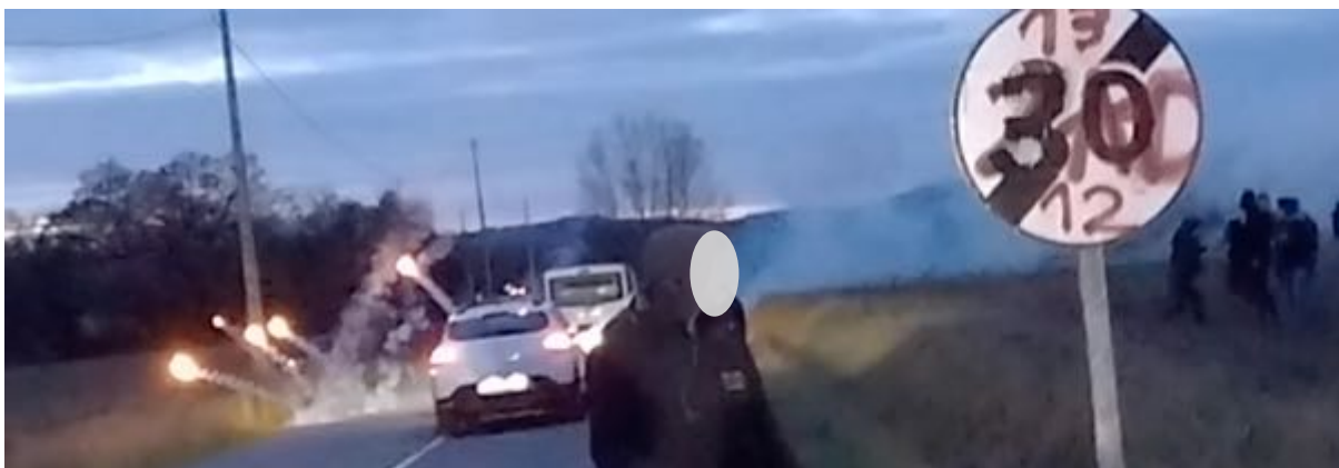
1er mars – Route de Semalens - Palets de lacrymogènes qui rebondissent au milieu des véhicules.

Puis, pendant environ 6 mn, les observateurs constateront le tir d'une trentaine de grenades ; ce qui fait pour 80 soutiens présents la bagatelle d'environ une grenade pour 3 personnes et, à raison de 6 palets lacrymogènes par grenade, de 2 palets par personne !