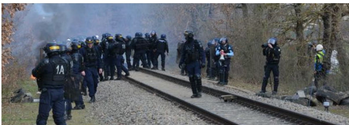
18 février – 15h59. A gauche de l'image, on devine sous le coude d'un CRS (bandes jaunes sur le casque et 1A marqué dans le dos), un cocktail Molotov en train de se consumer. A droite de l'image, les observateurs en position.

Lors de certains épisodes, très rares en fait, nous avons constaté, de la part de certains opposants, des jets de pierre (le ballast de la voie ferrée n'est jamais très loin...) et, une fois en 18 présences sur site, l'utilisation d'engins incendiaires, des cocktails Molotov, au nombre de deux, lancés au niveau d'une haie bordant la voie ferrée.