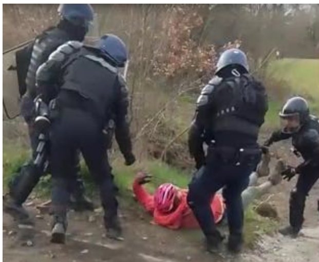
Les gendarmes en action avec une personne inconsciente qui est déposée sans ménagement sur le bas-côté.