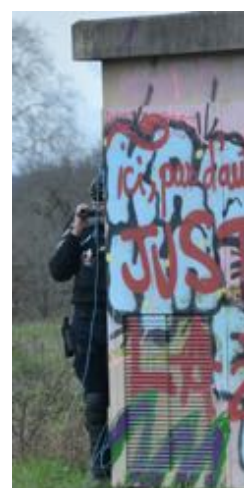
Image centrale : un gendarme mobile cagoulé. Sur ces trois images, on constate aussi la prise de photos et vidéos permanente ; y compris depuis un engin de chantier du concessionnaire.