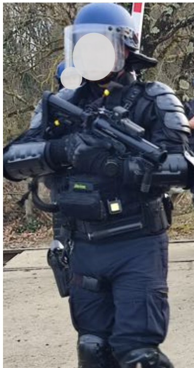
18 février – Un gendarme avec un LBD « dernier cri » et un autre avec un Cougar.