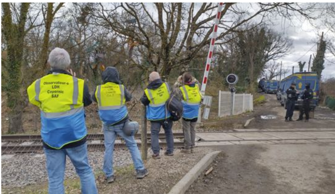
1 er mars 2024 - Les observateurs positionnés au passage à niveau.

Lors de ces journées d'attente, les observateurs circulent au « passage à niveau », « au carrefour » et sont constamment observés et tenus à distance par les FDO.