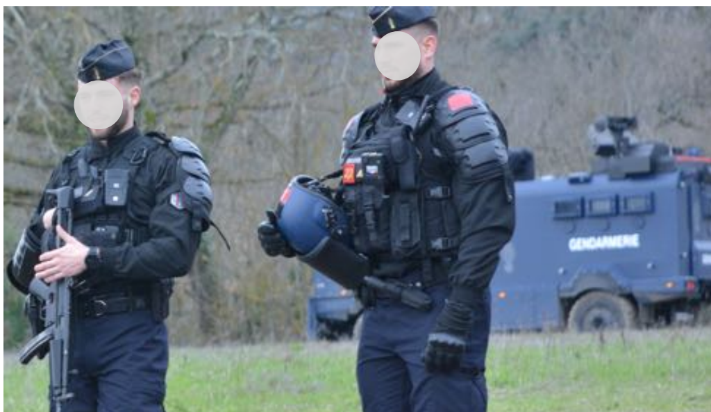
3 mars 2024 – Fusil mitrailleur et blindés à Saïx. Mais pour faire la guerre à qui ?

Un groupe de femmes avance au-devant de ce groupe avec des sacs de nourriture destinée aux occupants des arbres. Des discussions s'engagent au son des accordéons et autres saxophones. Des lys sont offerts à des gendarmes. A l'arrière, à 100 m, trois gendarmes sont équipés de lanceur Cougar aux côtés d'un Centaure qui pointe son lanceur, son « orgue de Staline », dans la direction du rassemblement. En seconde ligne, derrière les boucliers, 2 gendarmes portent des LBD. Les gazeuses à main sont constamment agitées, les matraques Tonfa sont sorties.