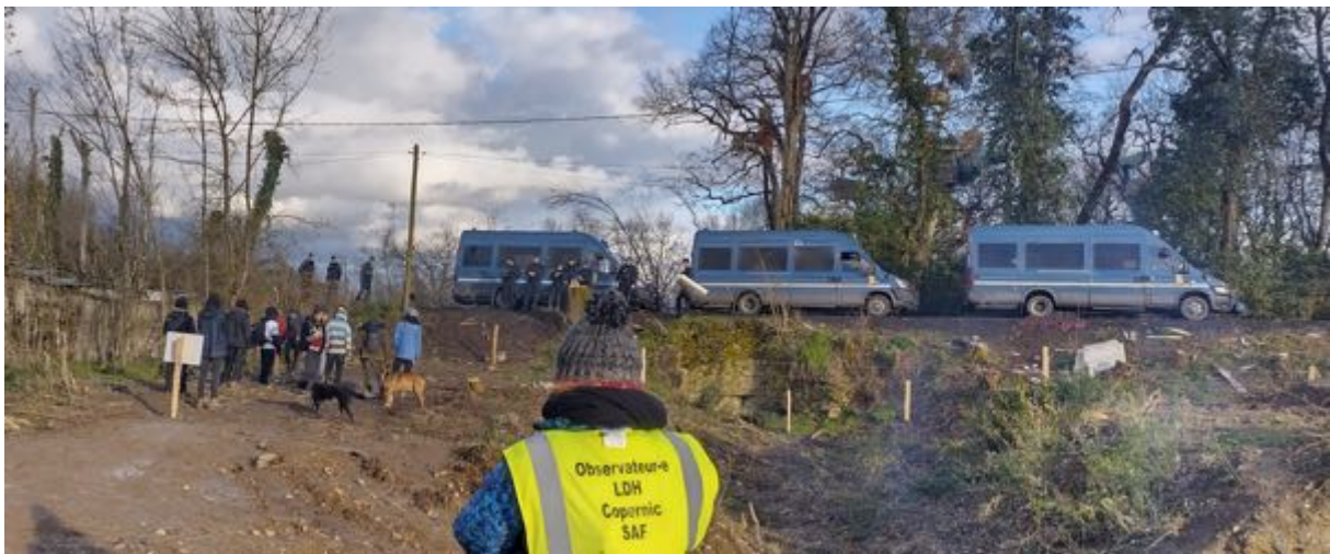
24 février 2024 – 17h17 au niveau du « trou » – Les fourgons de la gendarmerie positionnés pour faire obstacle à l'observation.

Cette restriction de la liberté d'observer est en contradiction avec les différents textes internationaux concernant les missions de documentation des observateurs indépendants. A titre d'exemple, dans un document de l'OSCE (Organisation pour la sécurité et la coopération en Europe - https://www.osce.org/fr ), le « Manuel de surveillance – Liberté de réunion pacifique », daté de 2020, il est fait référence au « Rapport du rapporteur spécial de l'ONU sur le droit à la liberté de réunion pacifique et d'association » daté du 13 août 2007 dans lequel il est précisé :