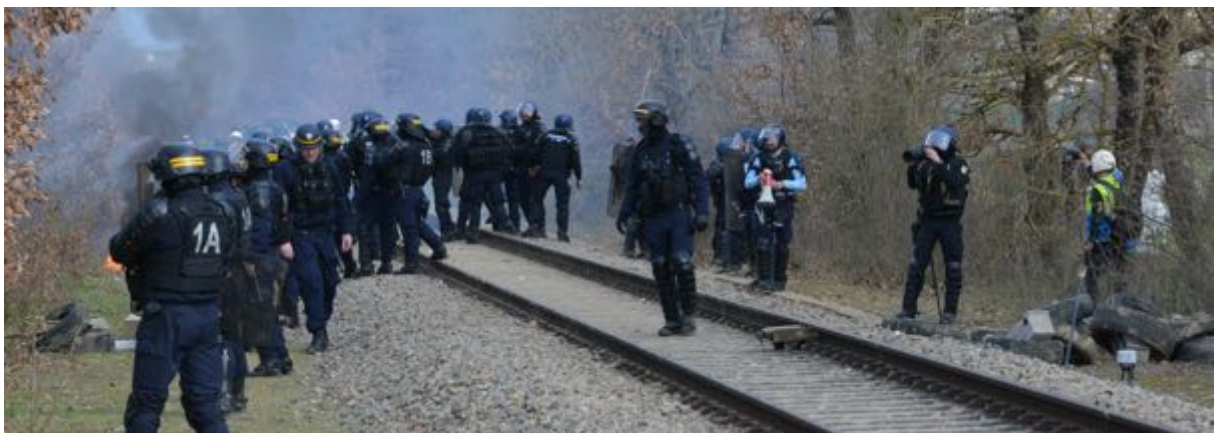
18 février – 15h59. A gauche de l'image, on devine sous le coude d'un CRS (bandes jaunes sur le casque et 1A marqué dans le dos), un cocktail Molotov en train de se consumer. A droite de l'image, les observateurs en position.

Lors de certains épisodes, très rares en fait, nous avons constaté, de la part de certains opposants, des jets de pierre (le ballast de la voie ferrée n'est jamais très loin...) et, une fois en 18 présences sur site, l'utilisation d'engins incendiaires, des cocktails Molotov, au nombre de deux, lancés au niveau d'une haie bordant la voie ferrée.