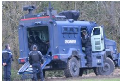
Un blindé Centaure, le 19 février à Saïx.

Ces nouveaux blindés de la gendarmerie, appelés Centaure, entrent progressivement dans la dotation en matériels de la gendarmerie. Leur présentation à la presse le 19 octobre 2023 8 était suffisamment parlante pour que le lecteur puisse prendre connaissance de leurs caractéristiques.