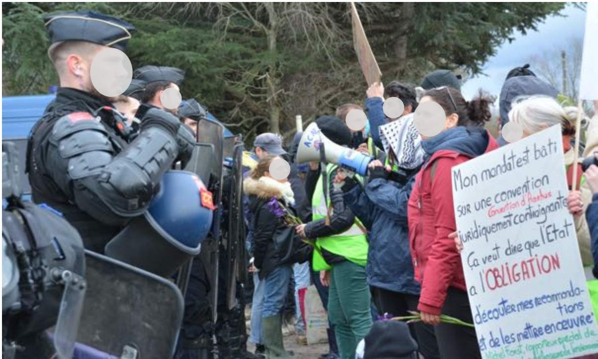
3 mars 2024 - Les soutiens aux écureuils face aux gendarmes. Leurs « armes » : pancartes, slogans, porte-voix et fleurs des champs...