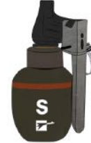
Grenade ASSD assourdissante

Les armes de la police et de la gendarmerie et leurs munitions.