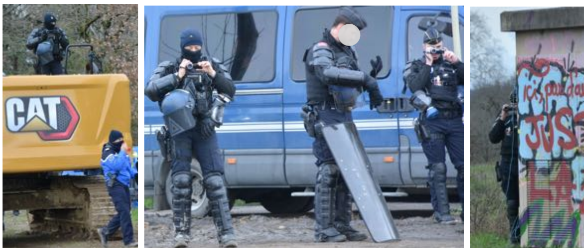
Image centrale : un gendarme mobile cagoulé. Sur ces trois images, on constate aussi la prise de photos et vidéos permanente ; y compris depuis un engin de chantier du concessionnaire.

Les conditions météorologiques justifient rarement cet équipement, comme en témoigne le jour de la descente des écureuils où la température est printanière (15°C et passages du soleil) mais où des EGM portent ces tours de cou devant l'état-major (un capitaine, trois colonels) et du Préfet du Tarn.