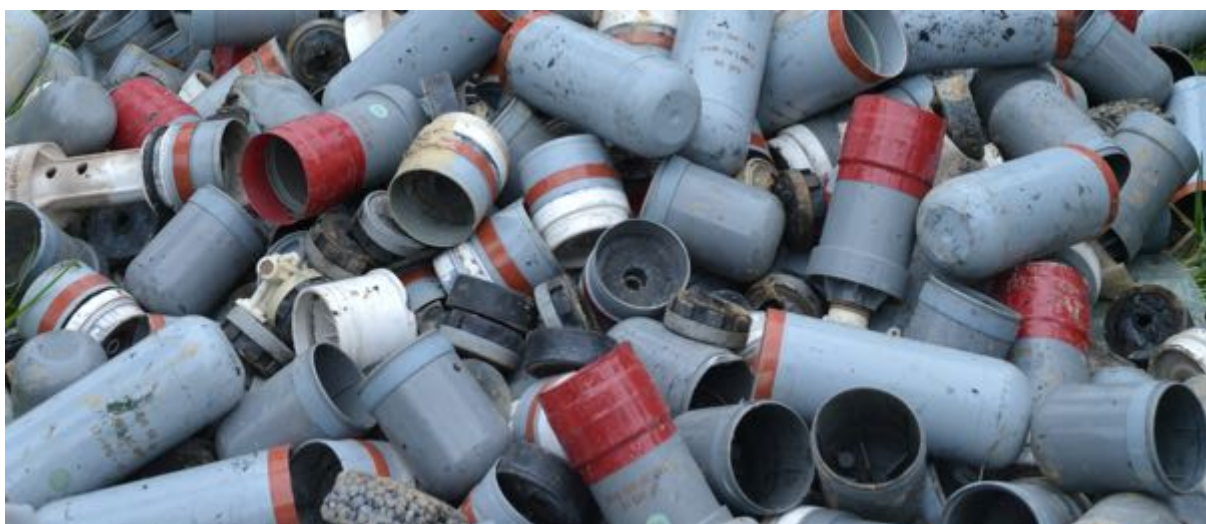
... qui laissent de drôles de déjections.