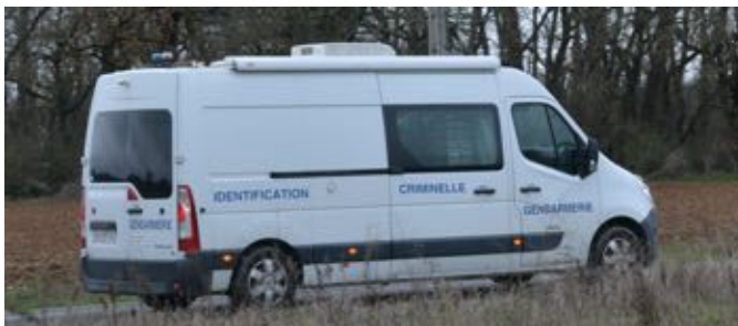
19 février 2024 - Un fourgon spécialisé de la gendarmerie.

Les observateurs ont aussi constaté la présence d'unités spécialisées dans la recherche criminelle. Les personnes qui occupent des arbres dans le cadre d'une action civile non-violente sont-elles donc des criminelles ?