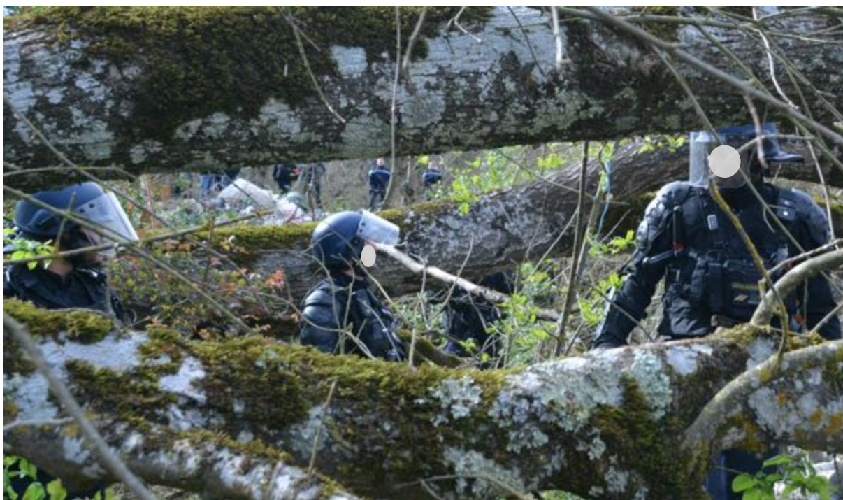
Dans les sous-bois du Tarn rôdent de drôles de scarabées...

La période couverte par le présent rapport va du 10 février au 24 mars 2024.