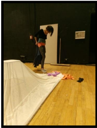
Figure 4 : expérimentation costume à l'université Bordeaux Montaigne