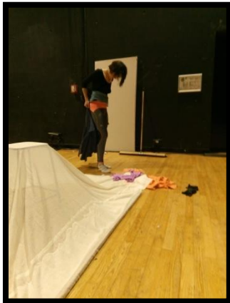
Figure 4 : expérimentation costume à l'université Bordeaux Montaigne