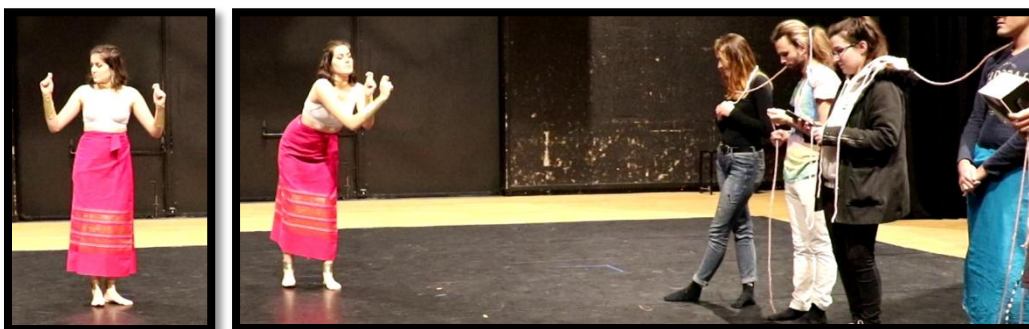
Figure 1 : les oiseaux "Bherunda" séparés puis réunis

Manon a choisi d'interpréter certains passages avec des gestes des mains codifiés : parmi les mudrā (terme utilisé dans les théâtres indiens classiques signifiant généralement « gestes des mains ») « choisis avec leur signification, citons « Bherunda ». Cette mudrā représente dans le style Bharata-nāṭyam un couple d'oiseaux mythiques, que nous avons découvert en cours pratique : « une main symbolise Juliette, l'autre Roméo, oiseaux inséparables », résume Manon. Autre exemple intéressant dans son utilisation contextuelle : la mudrā kapota , signifiant « le coffret » au sens littéral, a été choisie pour exprimer ici « l'amour secret ».