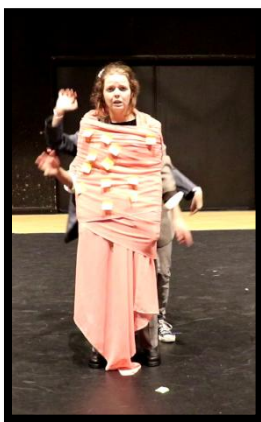
Figure 3 : les post-its et les gestes-mains multipliés

Ils lui collent ensuite des post-its où les personnes du public ont préalablement noté des injonctions de notre quotidien.