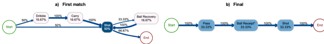
Figure 1: Process map illustrant la séquence des deux dernières actions menant à un tir réussi pour l'Espagne lors de son premier match (à gauche) et de la finale (à droite).

indique plusieurs opportunités pour marquer un but. Deux sous-ensembles d'actions principaux conduisant à un but se dégagent. Pour la combinaison Dribble-Carry-Shot, il s'agit d'une opportunité de tir direct, comme cela a été observé dans d'autres matchs. La combinaison Ball Recovery-Shot, représente plusieurs tentatives précédant un tir réussi. Plus précisément, 16,67% des activités répertoriées impliquent des tentatives de reprise de possession du ballon par une joueuse adverse. Dans tous les cas où cette tentative a abouti, elle est suivie d'un contrôle du ballon au niveau du pied de la joueuse en mouvement, ce qui conduit systématiquement à un tir. En outre, un cas isolé montre qu'un tir sur trois est suivi d'une tentative de reprise de possession, ce qui indique que, lorsqu'une joueuse adverse intercepte le ballon après un tir dans la zone adverse, cela conduit toujours à un autre tir. En revanche, le process map de droite est linéaire en raison de l'unique but marqué lors de la finale. Le schéma de jeu gagnant, qui est très simple, indique qu'une passe bien reçue a été suivie par un tir réussi. Cette comparaison met en évidence :