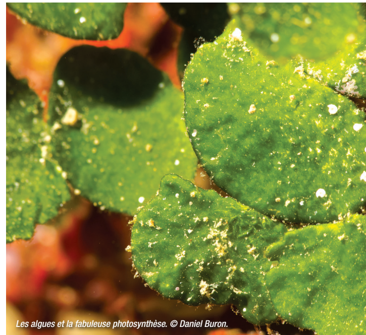
Les algues et la fabuleuse photosynthèse.

Parmi les grandes algues marines environ 7000 espèces d'algues rouges, 2000 espèces d'algues brunes et 2000 espèces d'algues vertes ont été décrites. L'importance des champs d'algues dans la production primaire via la photosynthèse est remarquable ; ils produisent autant que les forêts tropicales. De plus, de nombreuses algues participent à la structuration de l'habitat en formant des végétations qui servent d'abris et de grenier pour de nombreuses espèces. Certaines espèces d'algues sont calcifiées et contribuent à la formation de biorécifs. Malgré ces rôles clés dans les écosystèmes benthiques rocheux,