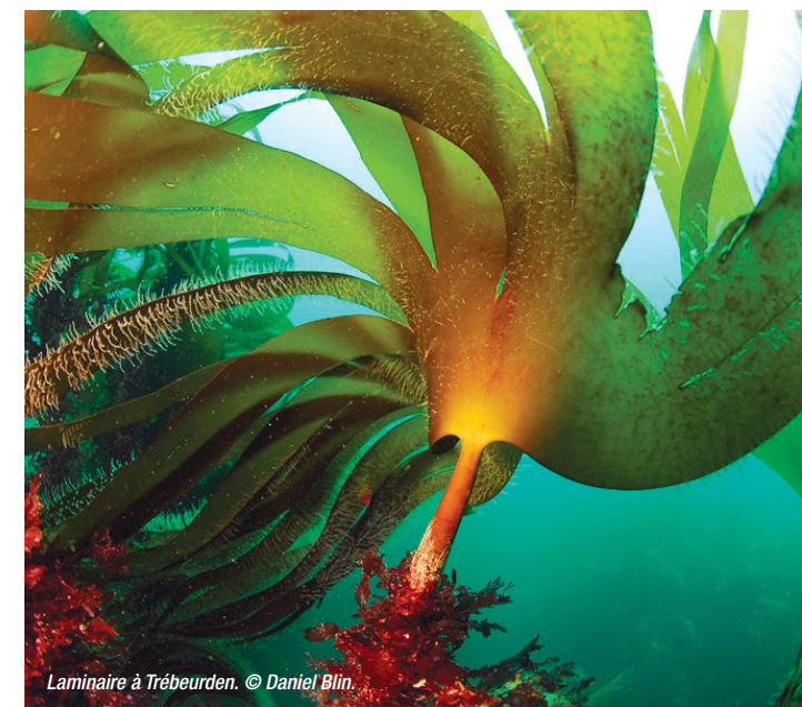
Laminaria à Trébeurden.