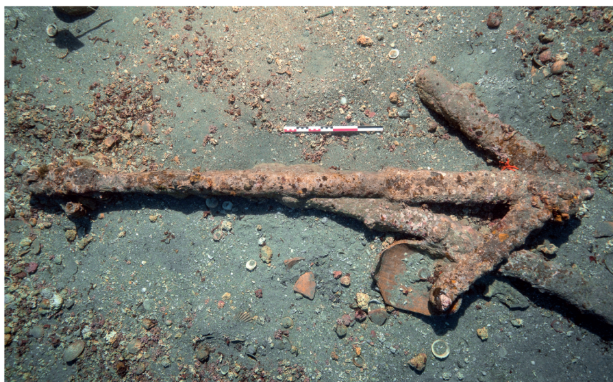
Fig.88. Vue de dessus de l'ancre « A »