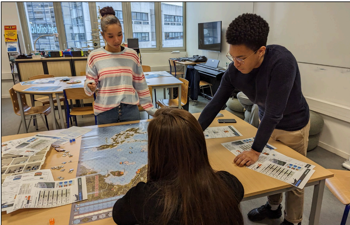
Figure 2. Séance de découverte du jeu South China Sea: Modern Naval Conflict in the South Pacific (Photo prise par l'auteur).

stimulants. Malheureusement, ils sont peu connus et drainent, parfois à raison, tout un imaginaire concernant leur complexité et temps de jeu. Notre rubrique s'inscrit donc dans la démocratisation de ces jeux et rend compte de séances de découverte réalisées par des étudiants de Licence et/ou de Master ne connaissant pas ou peu l'activité de wargaming ou de belliludisme. Chaque article, co-écrit par les étudiants eux-mêmes, est formaté de la même manière : une introduction au jeu, des témoignages des étudiants joueurs et une synthèse de la séance 3 . Cette dernière se déroule sur une demi-journée mais intègre des ressources à étudier en amont : lecture d'un article, visionnage d'un documentaire, etc. En revanche, l'apprentissage des règles du jeu fait intégralement partie de la séance (Figure 2). À ce titre, les co-auteurs des articles ont également la charge de bien connaître les règles pour accompagner leurs camarades le jour J. Les témoignages des participants sont rédigés à chaud, dès la fin de la partie. Enfin, la place de l'équipe pédagogique est plutôt faible puisqu'un enseignant s'occupe de la partie logistique (réservation de la salle et du jeu), de la relecture de l'article et de faire la liaison entre les co-auteurs étudiants et le rédacteur en chef du magazine (qui n'a donc qu'un unique point de contact plutôt que de multiples co-auteurs renouvelés à chaque session).