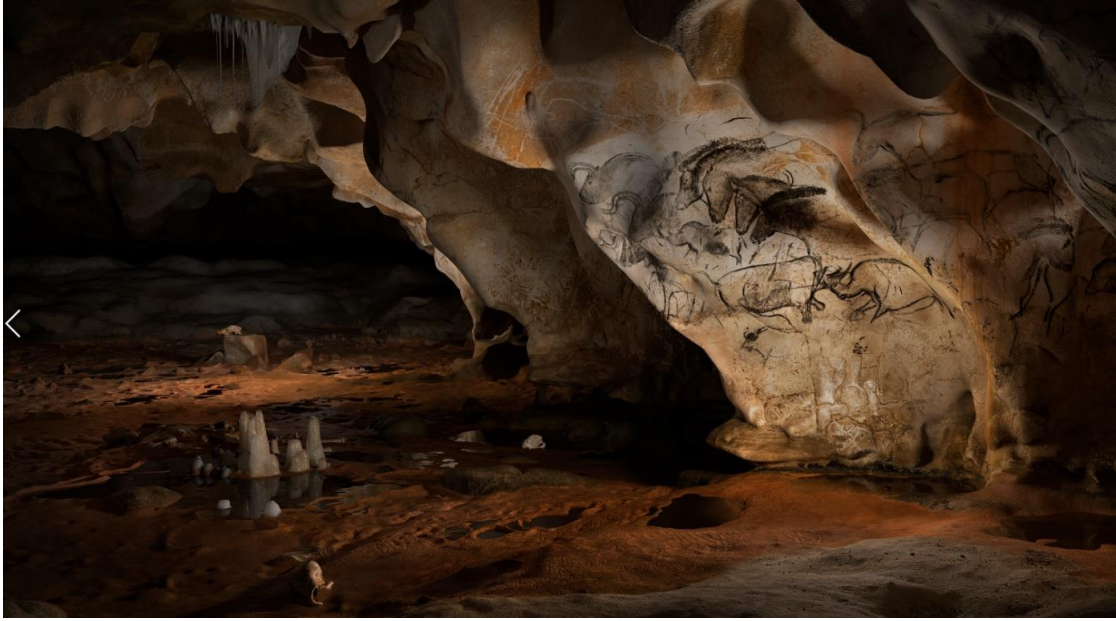
Шове – Министерство культуры. Chauvet – ministère de la culture