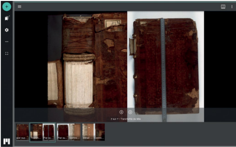
Figura 3 Visualizzazione delle riproduzioni di legature nella biblioteca digitale dell'IRHT, ARCA tramite IIF Mirador Viewer. https://arca.irht.cnrs.fr/ark:/63955/md68x920j956

CD-ROM che consentiva di visualizzare un numero maggiore di immagini in modo più dettagliato rispetto a quelle stampate; l'insieme dei dati di questo volume, nonché degli altri tre, è già da qualche tempo disponibile online (Kagan 2016), nella stessa biblioteca digitale secondo gli standard IIF, e consultabile sempre tramite il suddetto database [fig. 3]. Con questa collezione di riproduzioni fotografiche e il database equivalente delle legature digitalizzate della Bibliothèque Nationale (2013-), aggiornato al 2023, che ne contiene più di 200, si dispone per la Francia di un'importante collezione rappresentativa che consente già alcuni primi approcci comparativi e quantitativi.