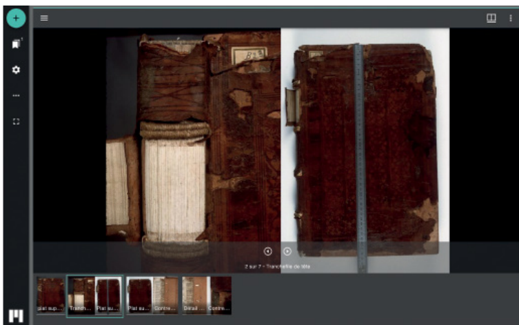
Figura 3 Visualizzazione delle riproduzioni di legature nella biblioteca digitale dell'IRHT, ARCA tramite IIF Mirador Viewer. https://arca.irht.cnrs.fr/ark:/63955/md68x920j956

CD-ROM che consentiva di visualizzare un numero maggiore di immagini in modo più dettagliato rispetto a quelle stampate; l'insieme dei dati di questo volume, nonché degli altri tre, è già da qualche tempo disponibile online (Kagan 2016), nella stessa biblioteca digitale secondo gli standard IIF, e consultabile sempre tramite il suddetto database [fig. 3]. Con questa collezione di riproduzioni fotografiche e il database equivalente delle legature digitalizzate della Bibliothèque Nationale (2013-), aggiornato al 2023, che ne contiene più di 200, si dispone per la Francia di un'importante collezione rappresentativa che consente già alcuni primi approcci comparativi e quantitativi.