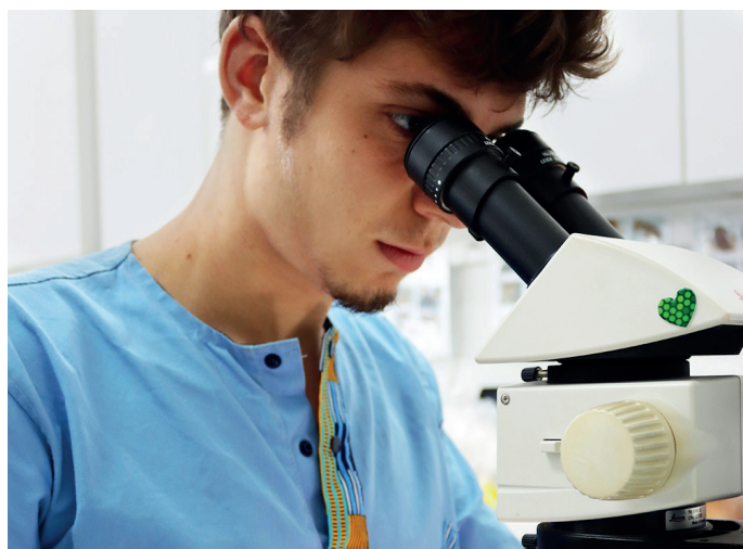
Identification des fourmis en laboratoire (CNRS/UMR EcoFoG)

réhabilitation commence par une expertise de terrain post-exploitation, après remise en place du cours d'eau et rebouchage des fosses d'exploitation (les « baranques »). L'objectif étant de caractériser les différents types de sols présents (texture, niveau d'hydromorphie, etc.) afin de sélectionner les espèces locales d'arbres les mieux adaptées à la future plantation. La deuxième étape consiste à les produire en pépinière. Les essences sélectionnées sont en majorité des légumineuses héliophiles ayant la capacité de se développer en pleine lumière sur des sols peu fertiles. Elles peuvent en effet utiliser l'azote atmosphérique pour leur propre croissance et le restituer au sol, d'où une amélioration de leur fertilité. Autre avantage : leur croissance rapide va apporter de l'ombrage qui permettra l'installation progressive d'espèces végétales sciaphiles, c'est-à-dire se plaisant à l'ombre. De plus, leurs fruits, très appréciés de la faune sauvage, vont favoriser la circulation d'animaux disperseurs de graines ramenant ainsi progressivement de la diversité faunistique et floristique forestière. Le but ultime de leur implantation est de favoriser le retour de la sylvo-génèse, l'ensemble des processus dynamiques s'observant au sein d'un éco-