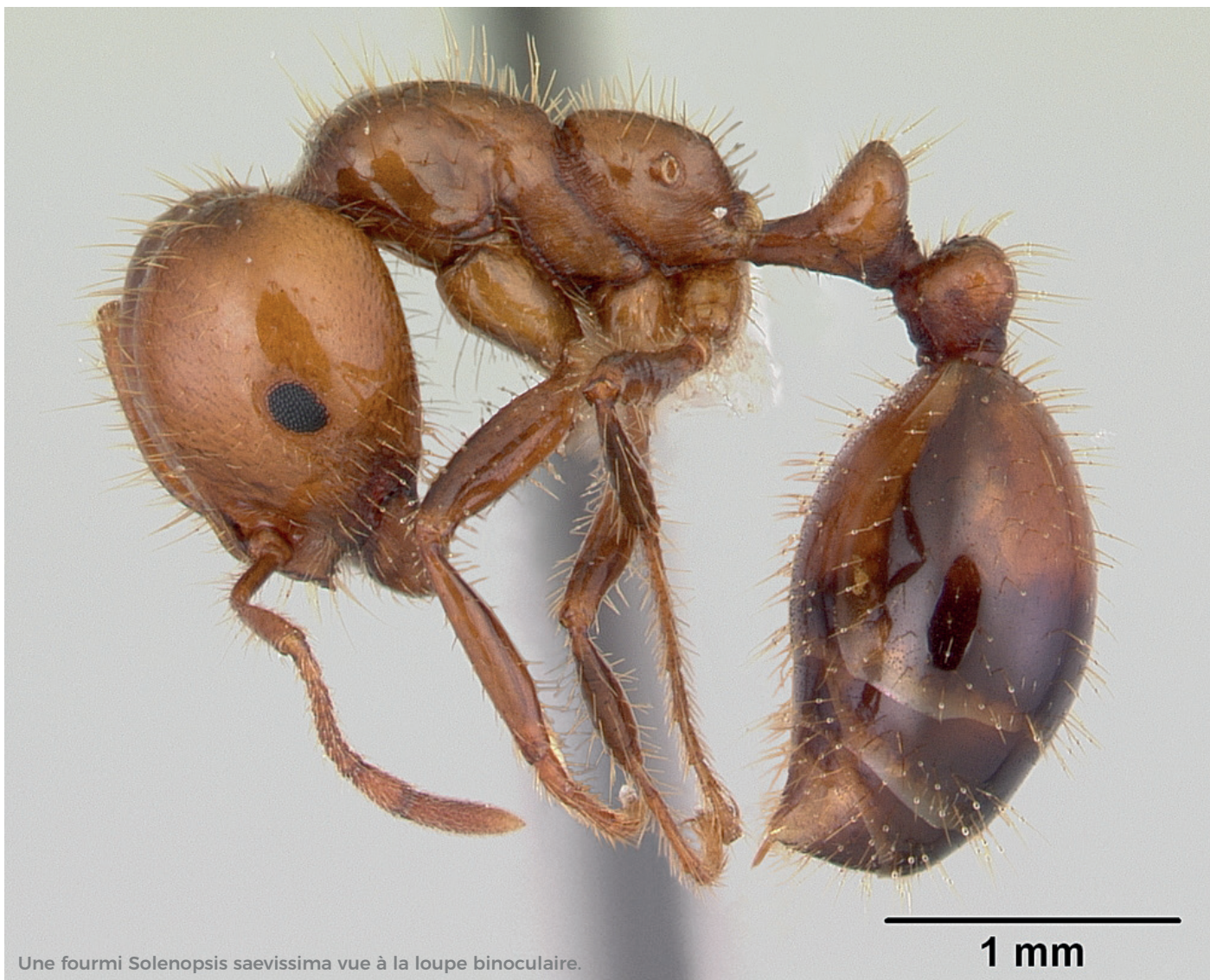
Une fourmi Solenopsis saevissima vue à la loupe binoculaire.