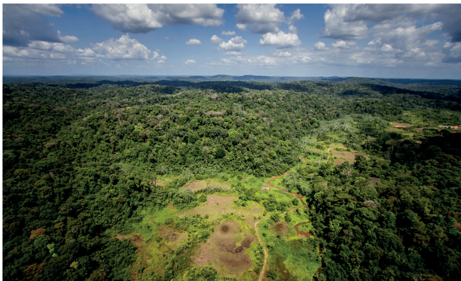
Vue aérienne d'une mine revégétalisée il y a 4 ans