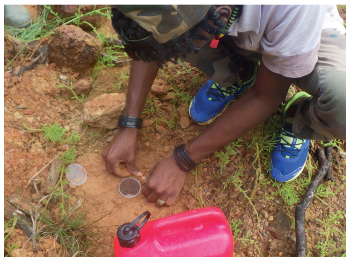
Pose de « pitfall » sur site minier revégétalisé il y a 1 an. Il s'agit d'un pot rempli d'eau, de savon et de sel dans lequel les fourmis vont tomber lorsqu'elles passent à cet endroit.