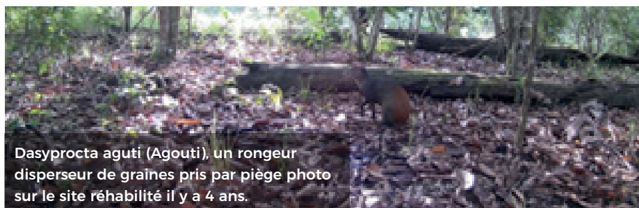
Dasyprocta aguti (Agouti), un rongeur disperseur de graines pris par piège photo sur le site réhabilité il y a 4 ans.