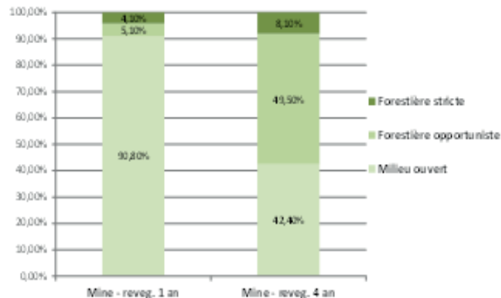
Figure 3 : Pourcentage d'occurrences de types de fourmis sur les sites revégétalisés d'âges différents

Autre constat, 90% des individus collectés sur le plus jeune site revégétalisé appartiennent aux espèces Solenopsis saevissima et Pheidole jelskii. Ce qui n'est pas surprenant, puisqu'elles sont caractéristiques des milieux ouverts. Mais après quatre ans, elles ne représentent plus qu'environ 1/3 des échantillons. Les deux autres tiers sont principalement des fourmis dites « forestières opportunistes », les premières de la forêt à coloniser de nouveaux milieux et qui sont souvent caractéristiques de forêts secondaires ayant subi de fortes perturbations. Elles appartiennent à un grand nombre d'espèces parmi lesquelles Campo-