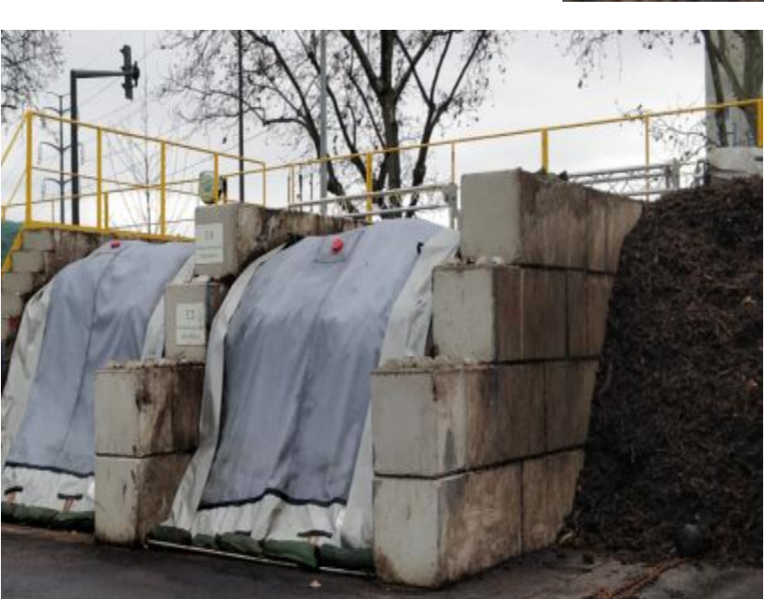
Compostage en plateforme