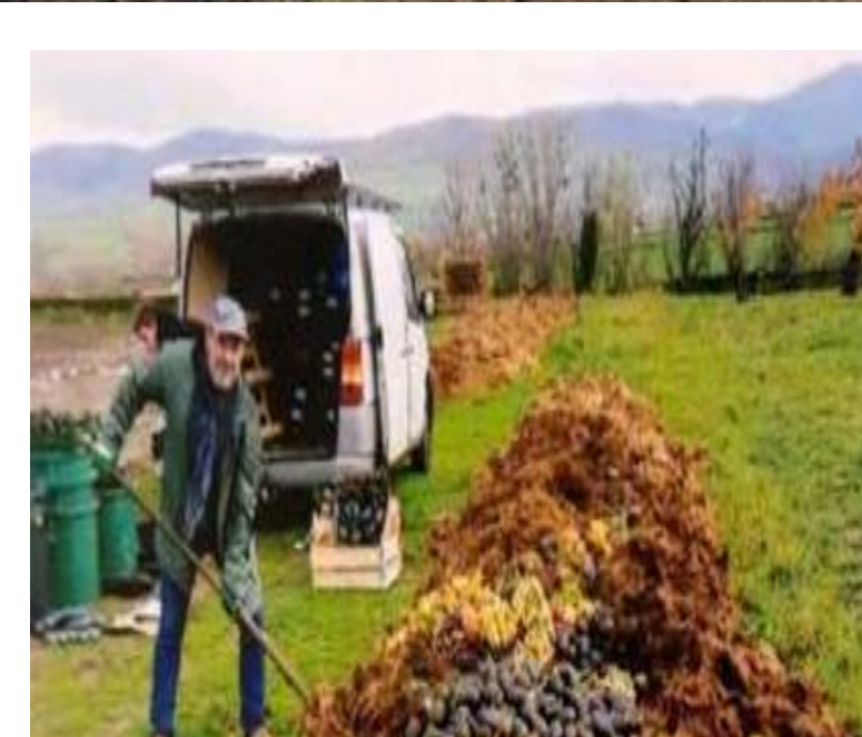
Vermi compostage en plateforme