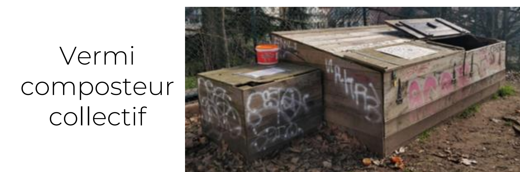
Vermi composteur collectif