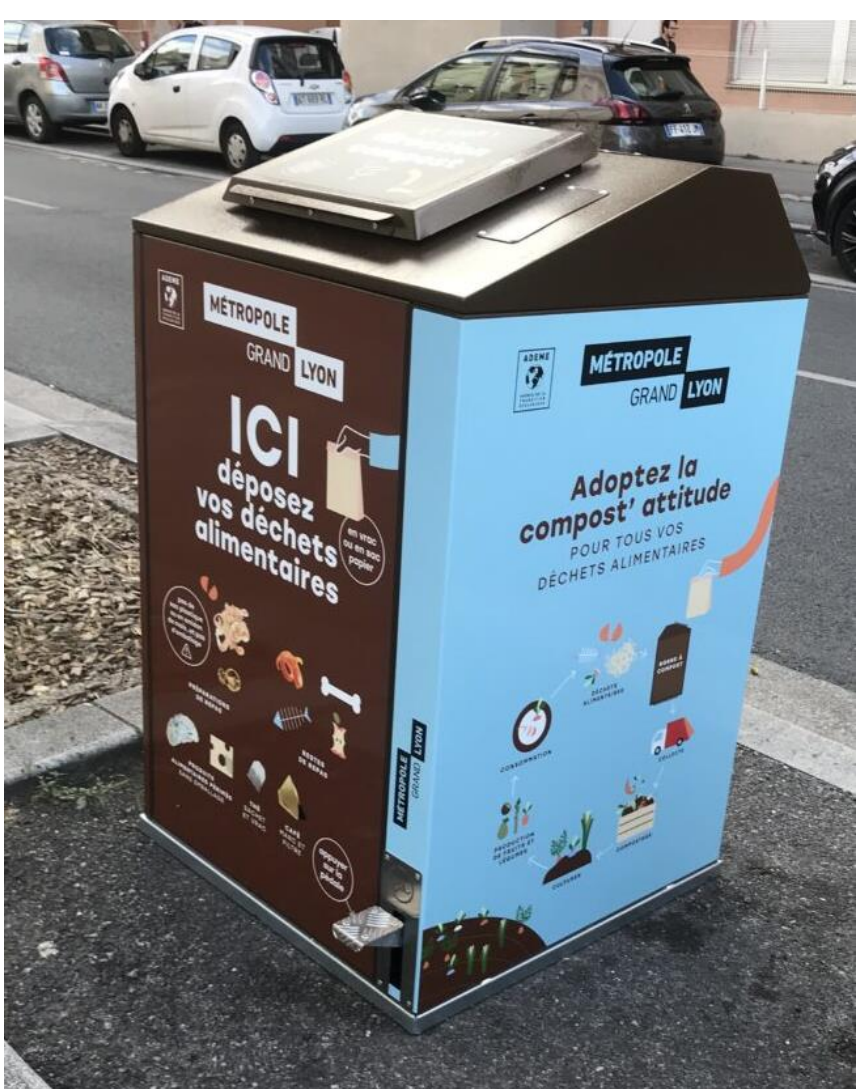
Borne à compost (à gauche) et vermicomposteur (ci-dessous)

Comment utiliser les vermicomposteurs ? En accès libre ou contrôlé