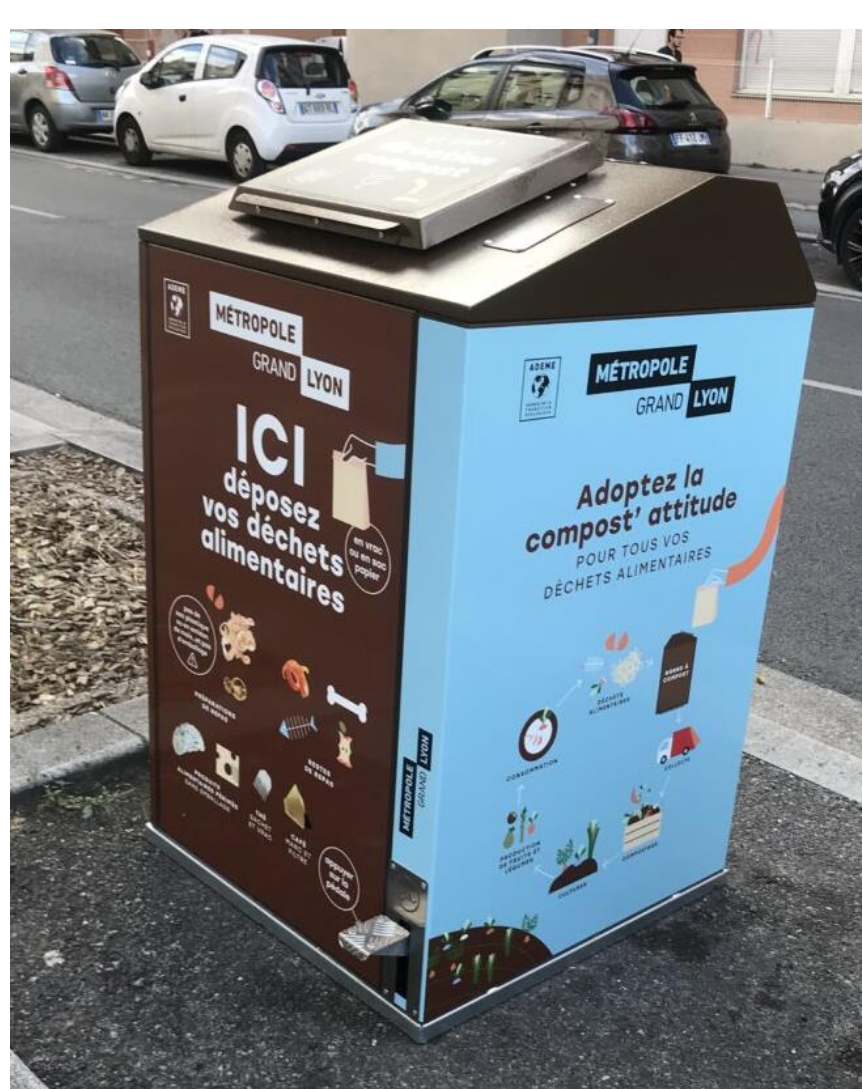
Borne à compost (à gauche) et vermicomposteur (ci-dessous)

Comment utiliser les vermicomposteurs ? En accès libre ou contrôlé