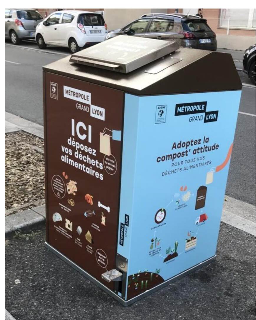
Borne à compost (à gauche) et vermicomposteur (ci-dessous)

Comment utiliser les vermicomposteurs ? En accès libre ou contrôlé