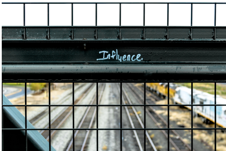
Elijah Macleod, Influence (2017), https://unsplash.com/photos/9xaLKZvYxnA .