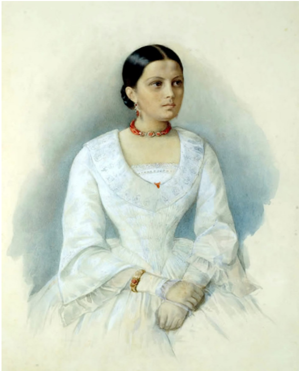
Portrait d'Avdotia Panaïéva par Kiril Gorbounov, années 1850.

de maîtresse de maison, ne ressemble pas du tout à une écrivaine 28 ; une seconde fois lorsqu'elle raconte l'histoire d'une visite à la datcha d'Alexandre Dumas, après un copieux petit-déjeuner préparé par son hôtesse, il lui assure voir « la première femme écrivain en qui il n'y a pas même l'ombre d'un bas-bleu 29 ».