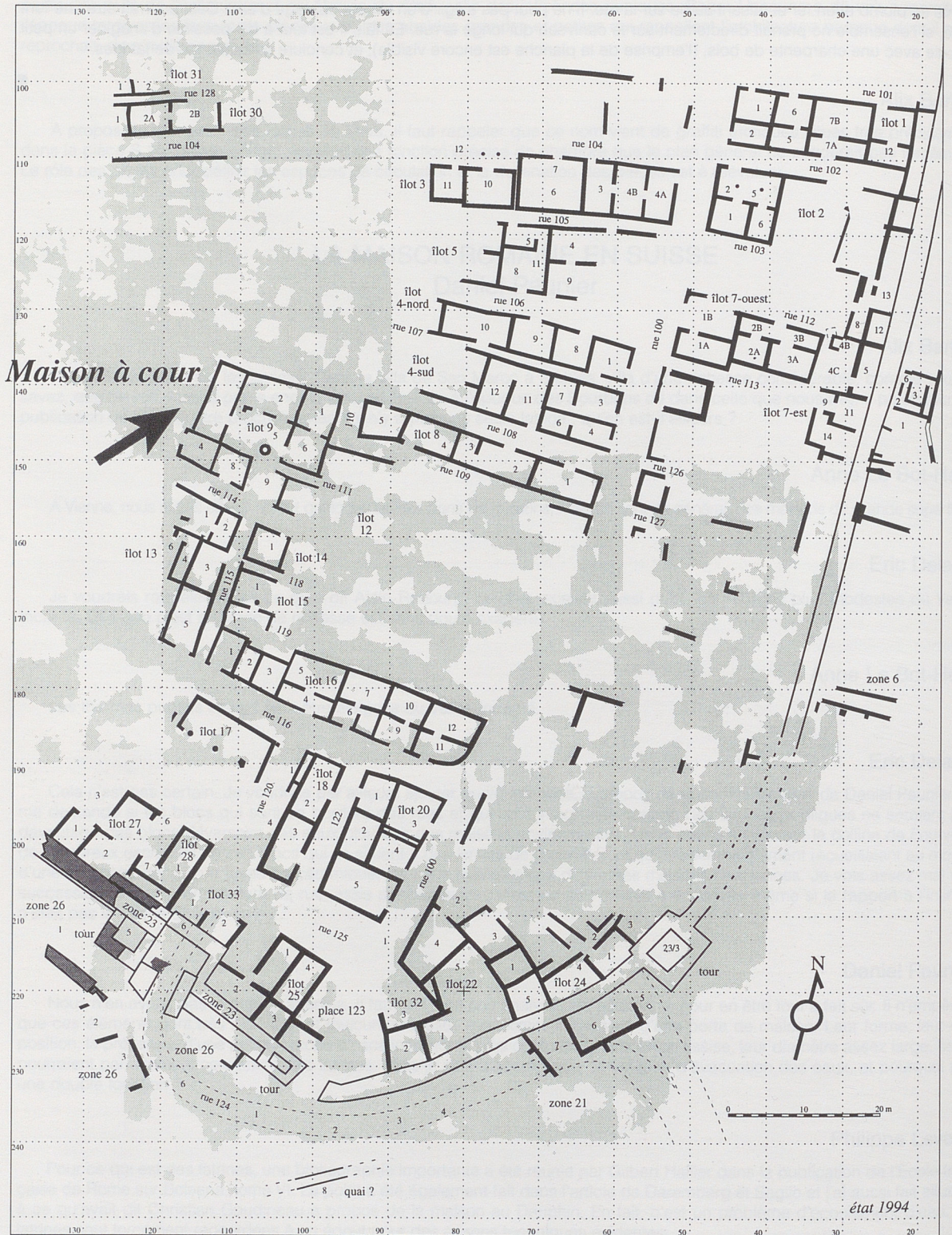
1. Plan de Lattes, état des fouilles 1994.