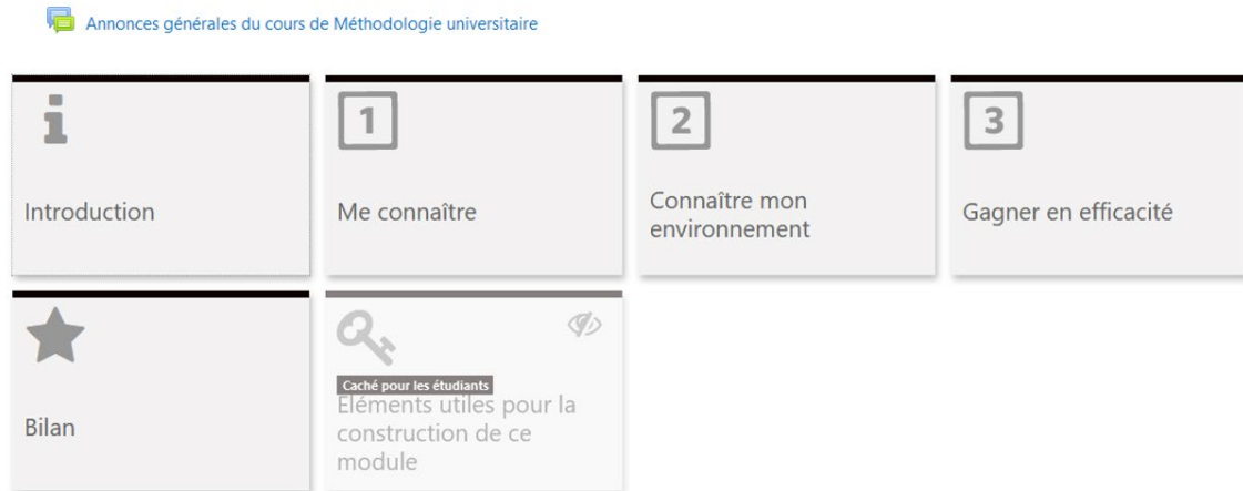
Figure 1 – Capture d'écran du cours Moodle