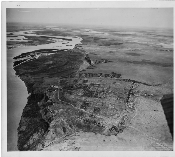
FIGURE 2 – Vue aérienne de Doura-Europos à la fin des années 1930.

puis par l'Empire romain jusqu'à sa destruction entre 250 et 260 EC par les Perses sassanides. La préservation remarquable de Doura-Europos résulte d'une stratégie défensive mise en place pendant l'un de ses sièges : le rempart ouest de la cité ayant été rempli de terre et de débris. Cette action désespérée a engendré des conditions idéales (climat chaud et sec) pour la préservation de la ville antique (Baird, 2018).