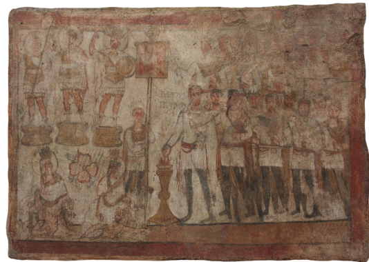
FIGURE 4 – Fresque représentant Julius Terentius accomplissant un sacrifice. Yale University Art Gallery, Wikimedia Commons.

une interface facile d'utilisation (Thornton et al., 2023) 9 .