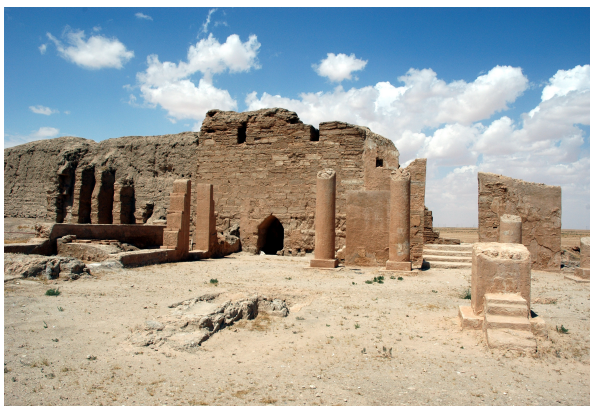
FIGURE 3 – Temple de Bêl, Doura-Europos.

comment un réseau complexe se développe entre des institutions, des objets, des archives, des archéologues, etc. La peinture murale découverte par le capitaine M.C. Murphy de Julius Terentius accomplissant un sacrifice (Figure 4) (Q49286023), soit l'un des premiers artefacts mis au jour à Doura-Europos, peut être remise en contexte avec le mur 0012 (Q109303235) du pronaos (Q109303233). Il existe plusieurs photographies de cette fresque dans les archives de la Yale University Art Gallery (Q1568434) où elle est entreposée, mais il est aussi possible d'en trouver dans d'autres archives, notamment les Fonds Maurice Pillet (Q124368651) et les Fonds photographique de la mission archéologique d'Europos-Doura (Q124368556) en France. Cette fresque a été étudié par James Henry Breasted, mais aussi par de nombreux autres chercheur-euse-s comme Lucinda Dirven et Clark Hopkins. De même, si nous remontons le fil d'Ariane que nous avons créé, nous pouvons identifier Julius Terentius (Q20379106) comme le tribun militaire romain de la Cohors XX Palmyrenorum (Q4457079) aussi mentionné dans une épitaphe de 239 EC à Doura-Europos (Q100306263).