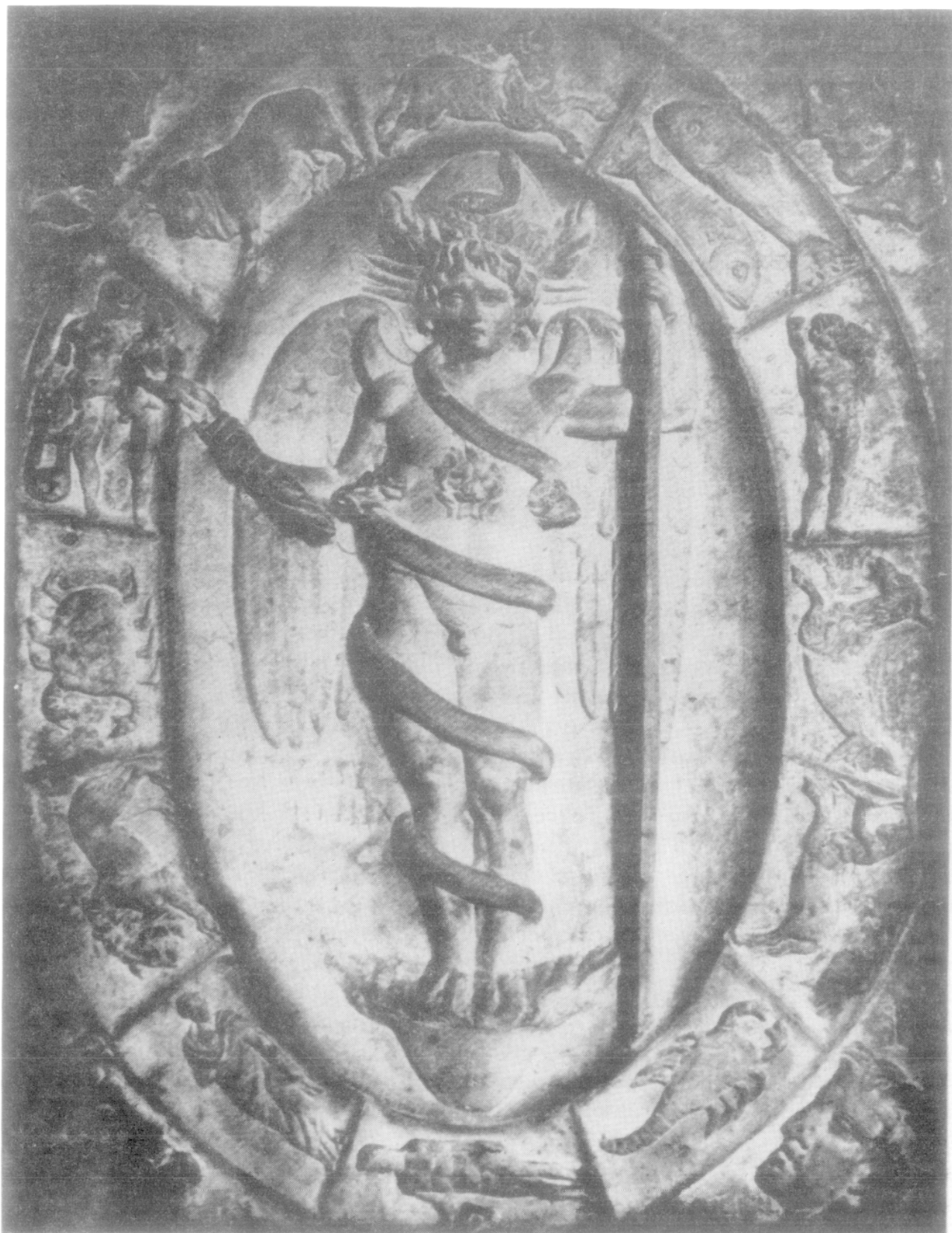
Fig. I. Représentation de Kronos Bas-relief de Modène (Vermaseren, t. I fig. 197)