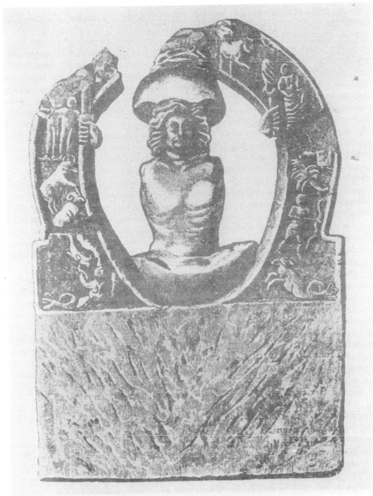
Fig. II. Représentation de Mithra, dit saecularis Bas-relief de Housesteads (Vermaseren, t. I fig. 226)