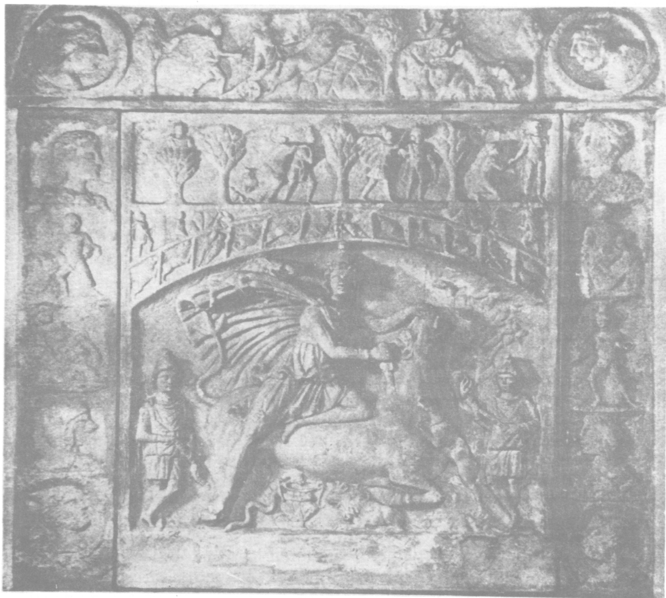
Fig. III. Bas-relief de Heddernheim (Vermaseren, t. II fig. 274)