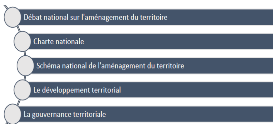
Figure 4 : Processus de l'aménagement du territoire au Maroc