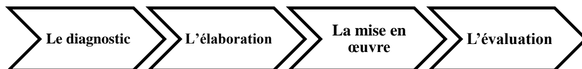
Figure 1 : Etapes d'élaboration d'un projet de territoire

Alors chaque projet de territoire se base sur quatre étapes successives :