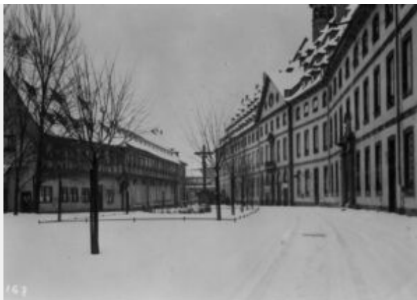
Hôpital civil de Strasbourg _ Hiver 1939-1940 _