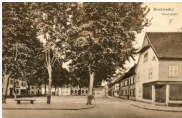
Bischweiler (Bischwiller)_ Baumplatz_