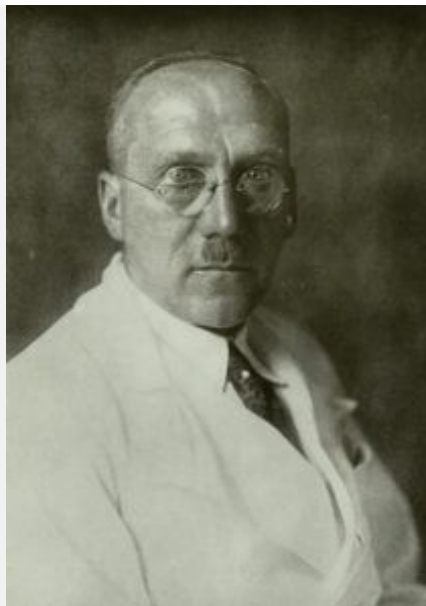
Prof. Ernst Ferdinand Sauerbruch