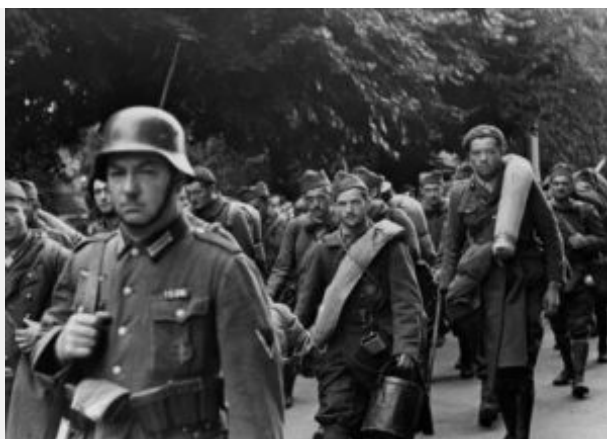
Prisonniers français _ 1940