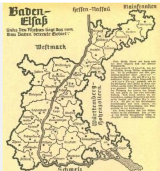
Gau Baden-Elsass _ Monatsblatt der NSDAP 1941