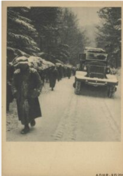
Troupes Alliées _ Vosges _ Hiver 1944-45 _